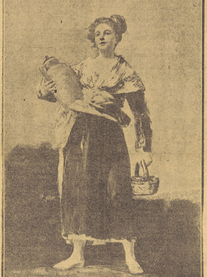
LA PORTEUSE D'EAU