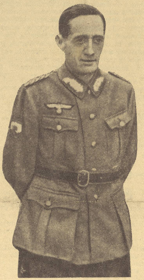
El jefe de la División Azul, general Muñoz Grandes.

han fracasado, siendo rechazadas con grandes pérdidas por los valientes voluntarios españoles. El general Muñoz Grandes—se añade— fué siempre alma de tal resistencia y gracias a su iniciativa y dotes de mando y al valor de sus soldados ha sido, en todas las ocasiones, brillante y decisivo el resultado de esos combates defensivos. La División Azul se ha distinguido una vez más por su arrojo y su valor en la lucha contra el comunismo.