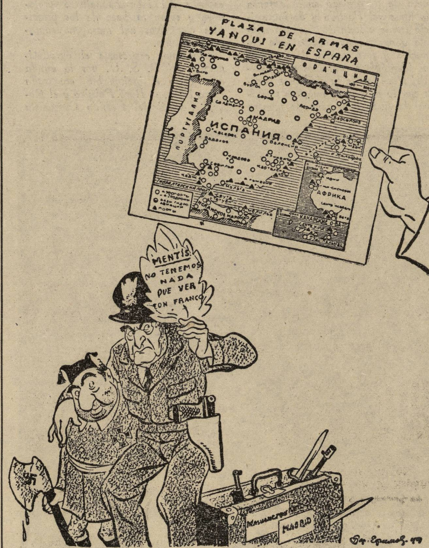
La hoja de parra norteamericana no puede ocultar que en la España franquista se preparan bases militares para los Estados Unidos.