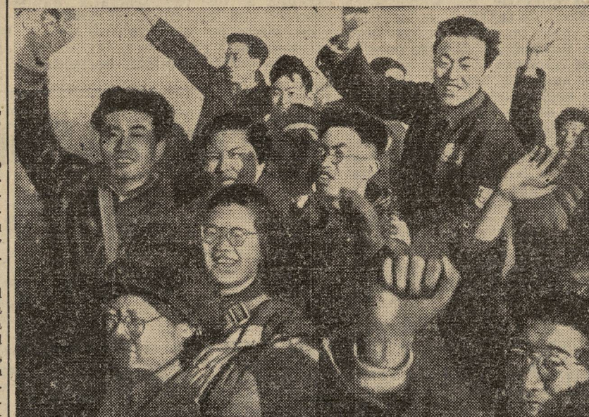
En uno de los actos recientemente celebrados en Pekín, jóvenes soldados, pilotos y estudiantes dan muestras del alegre entusiasmo que les produce la marcha triunfante de la democracia en China.

lante de los satélites rubricó en la O.N.U. la histeria belicista y abyecta de los fomentadores de la guerra.