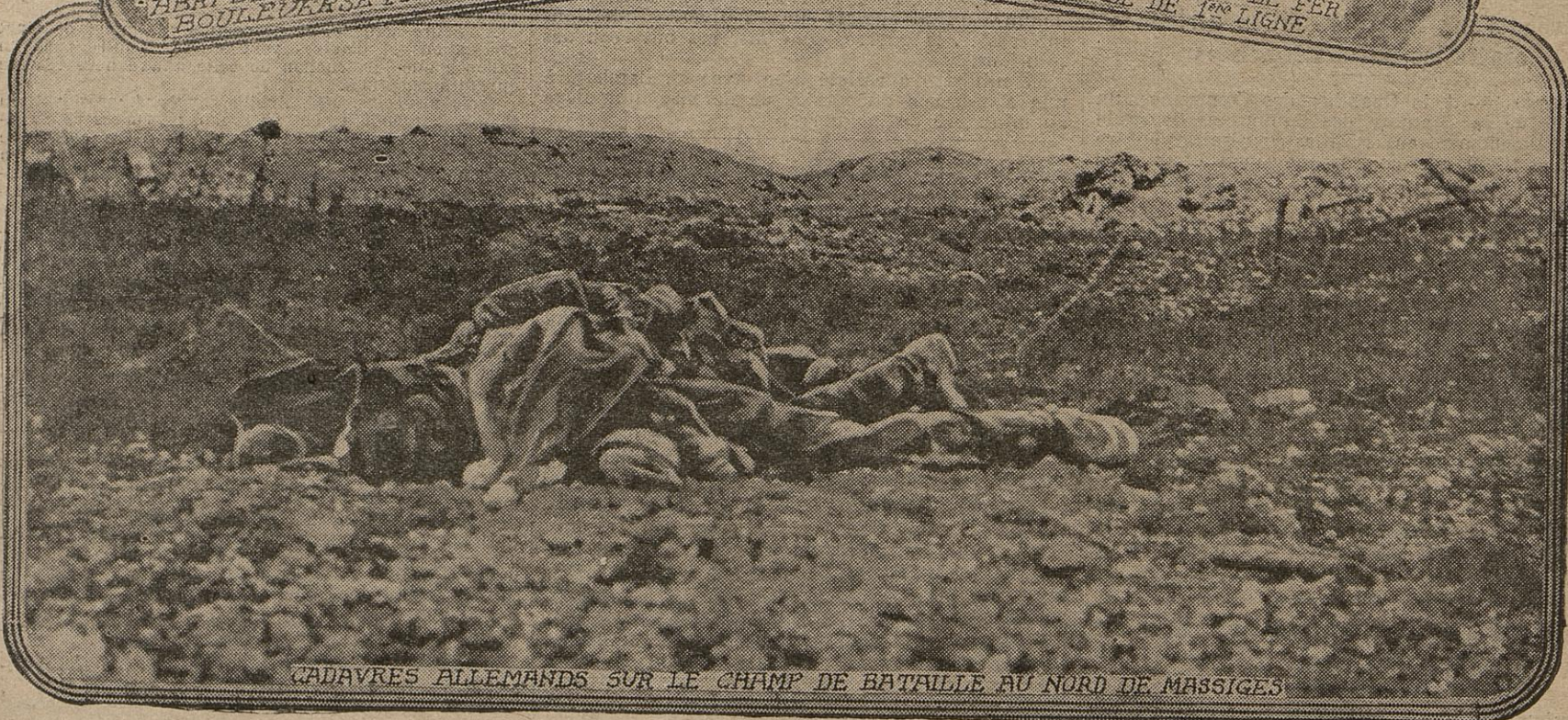
CADAVRES ALLEMANDS SUR LE CHAMP DE BATAILLE AU NORD DE MASSIGES

Dans la région du village de Massiges se déroula, il y a quelques semaines, une des plus terribles actions de la grande guerre. L'élan de nos défenseurs fut tel que, sur la majorité des points d'attaque, le succès couronna leurs efforts. C'est dans les positions conquises par eux, aux abords de la fameuse « Main » dont il a été parlé, qu'ont été photographiées ces anciennes défenses ennemies désormais en notre pouvoir.