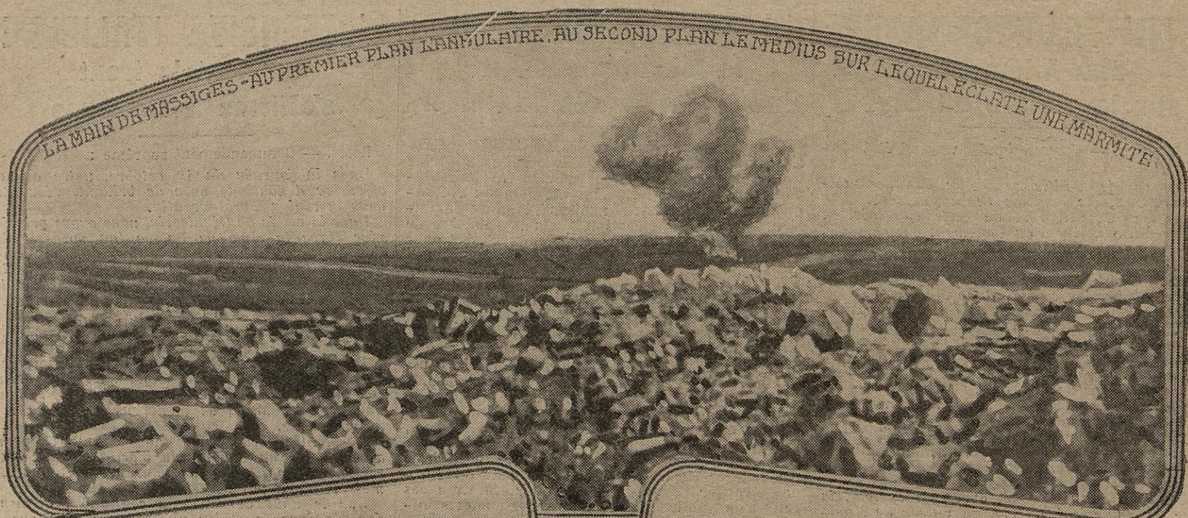
LA MAIN DE MASSIGES - AU PREMIER PLAN L'AMBULANCE. AU SECOND PLAN LE MEDICUS SUR LEQUEL ECLATE UNE MARMITE