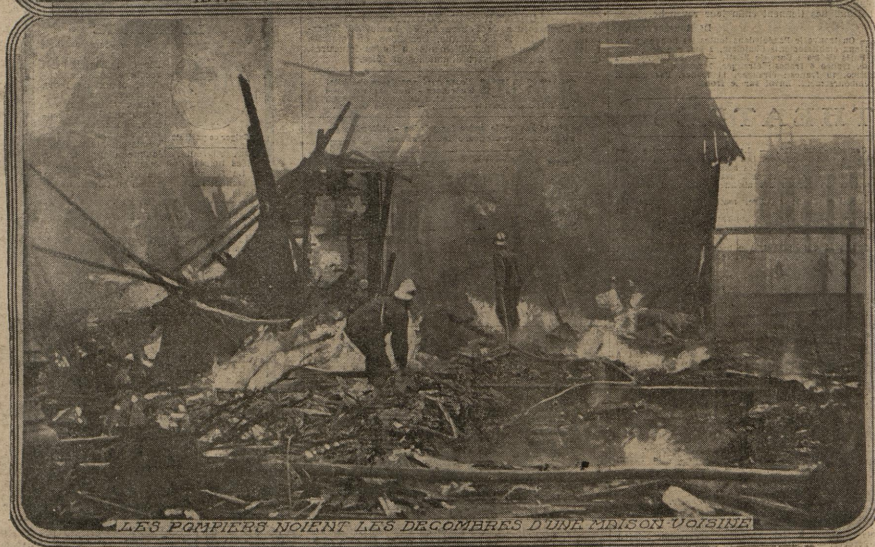
LES POMPIERS NOIENT LES DECOMBRES D'UNE MAISON VOISINE