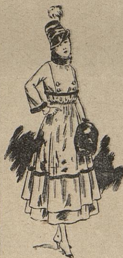
Robe de taffetas dahlia, garnie de skung. Chapeau même ton.