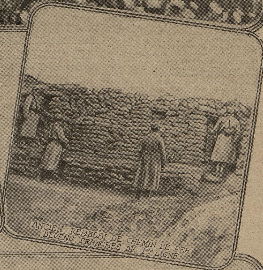
ANCIEN REMBLAI DE CHEMIN DE FER DEVENU TRANCHEE DE 1 re LIGNE