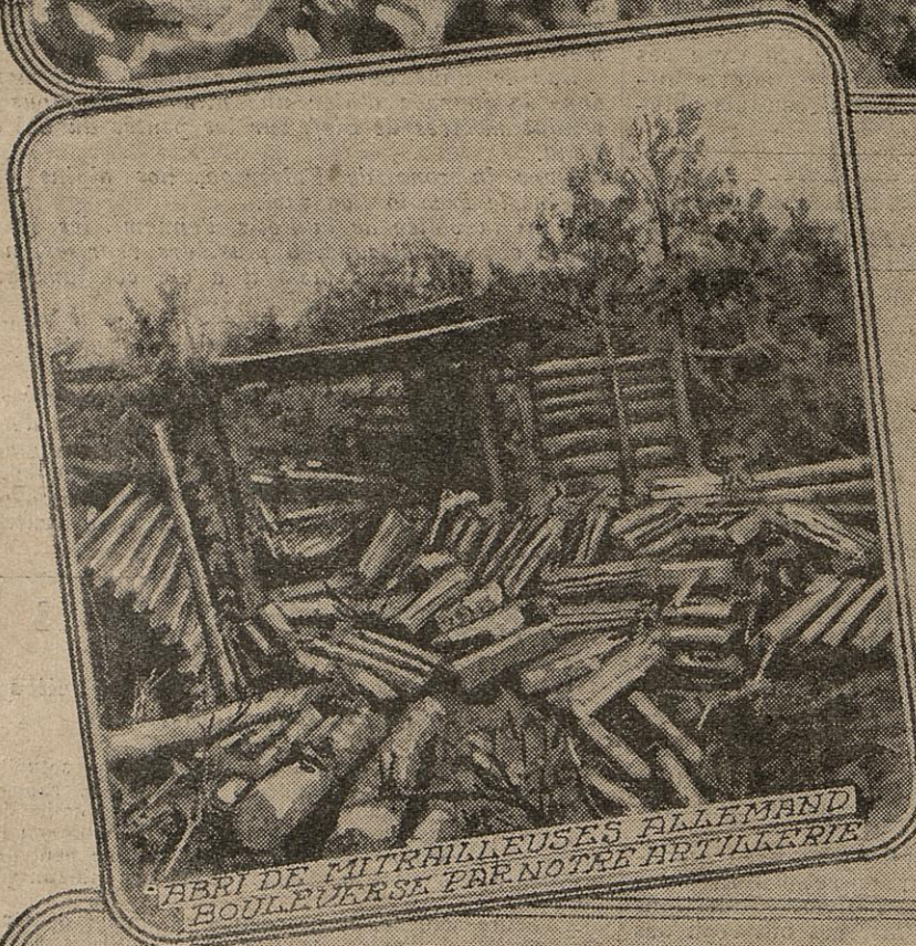
ABRI DE MITRAILLEUSES ALLEMAND BOULEVERSE PAR NOTRE ARTILLERIE