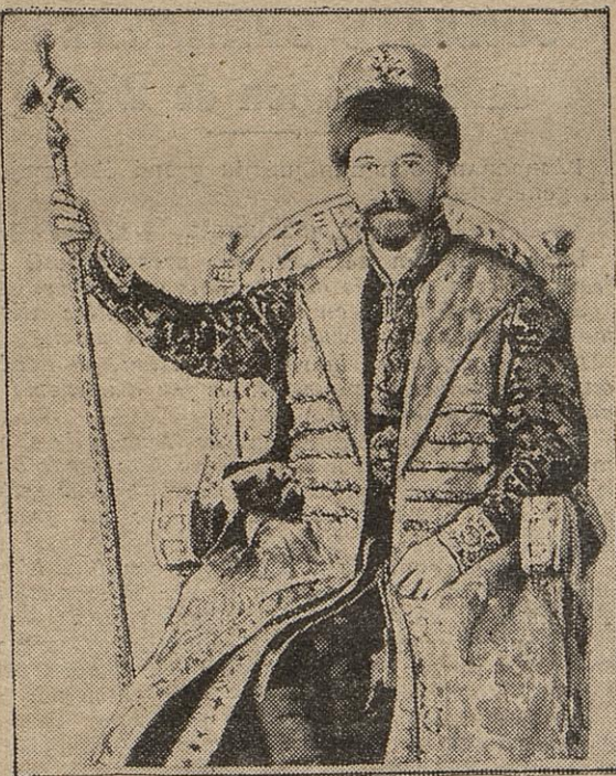
LE TSAR, CHEF DU SLAVISME ORTHODOXE

de la Bulgarie. Nicolas II précise que les aspirations bulgares sur la Macédoine auraient été satisfaites, si le gouvernement de Sofia l'avait voulu, « par une voie conforme aux intérêts du slavisme ». Sur ce seul point, nous nous permettrions de discuter le manifeste, croyant, quant à nous, que le slavisme n'avait rien à gagner à l'exaltation de l'orgueil bulgare. Mais les résolutions présentes du tsar sont d'autant plus significatives qu'elles succèdent à un plus long parti pris de faiblesse pour les Bulgares; pour cette