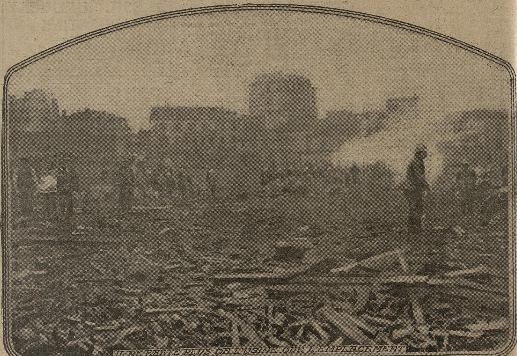
IL NE RESTE PLUS DE L'USINE QUE L'EMPLACEMENT