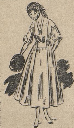
Robe de velours vieux bleu. Chapeau noir avec voile de dentelle.

Le second modèle est en velours vieux bleu et d'une simplicité de lignes fort élégante. La manche, très nouvelle, donne une indication très précise de ce que sera la mode du printemps prochain. Il se pourrait bien alors que la manche unie et plate eût cessé de nous plaire. Une plaque d'émail ancien ou un gros camée ferme le corsage, car les pierreries et bijoux de prix ne se montrent guère actuellement. Le petit chapeau de peluche noire, simplement garni d'une ruche de ruban, est entièrement nimbé d'un voile de dentelle noire bordé de ruban. Ces voiles flottants, posés de diverses façons, sont une des folies du moment ; courts ou longs, ils badinent sur le visage, leurs ramages font valoir l'éclat des yeux ou la ligne de la bouche, et, s'ils ne conviennent peut-être pas à la toilette très simple, ils ont grande allure dès que la robe est un peu plus élégante.