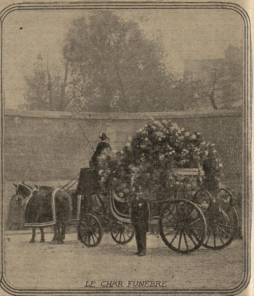
LE CHAR FUNÈBRE