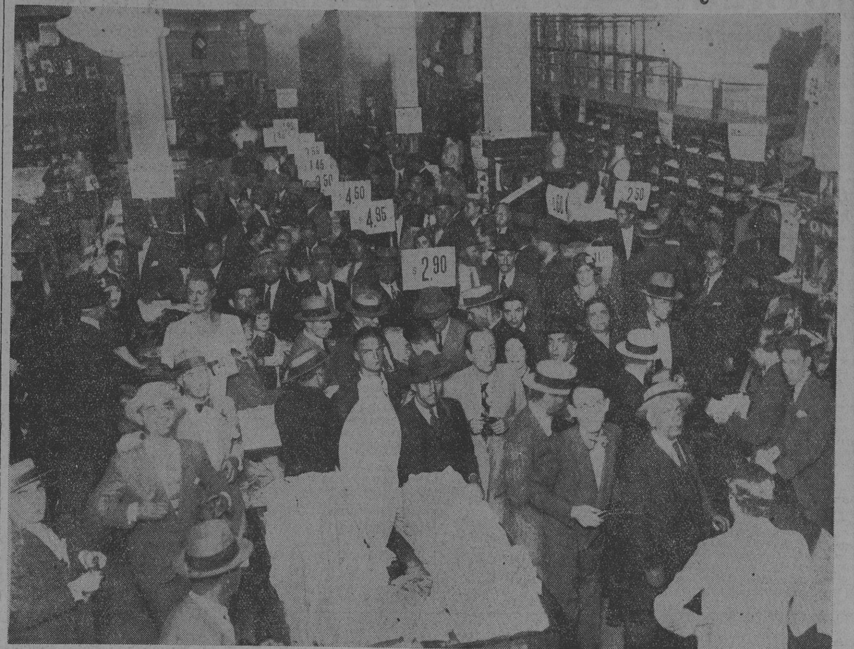
EL PUBLICO LLENA LOS AMPLIOS SALONES DE VENTA DE LA ACREDITADA CASA "ALBION HOUSE" Y NADIE SALE SIN COMPRAR, PUES VENDE A PRECIOS INCREIBLES