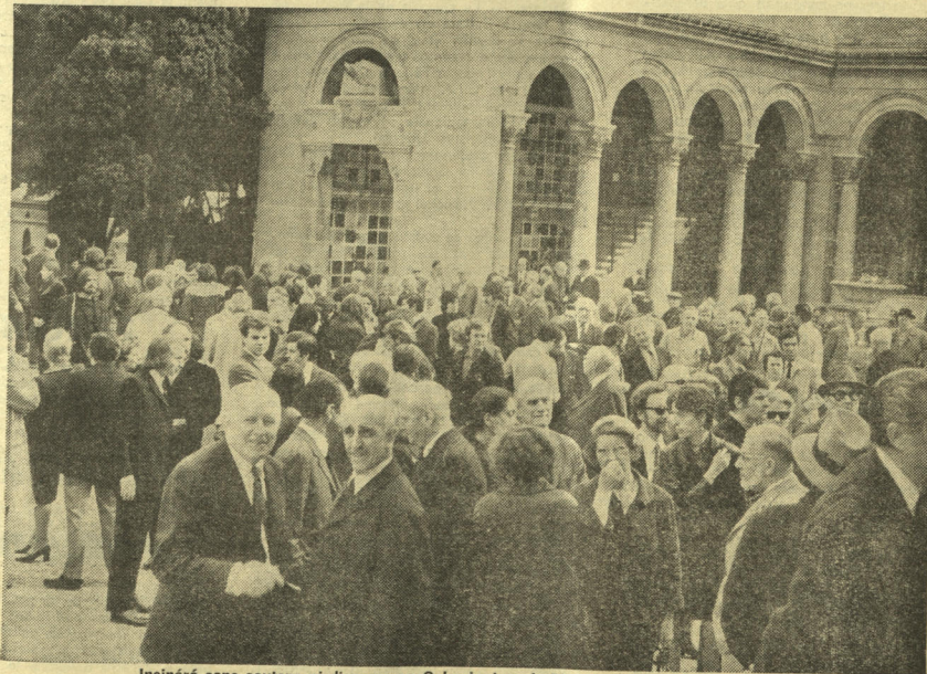
Incinéré sans soutane ni discours au Colombarium du Père Lachaise - Case N° 12 049. (Voir article sur les obsèques par S. Chevet, page 11.)