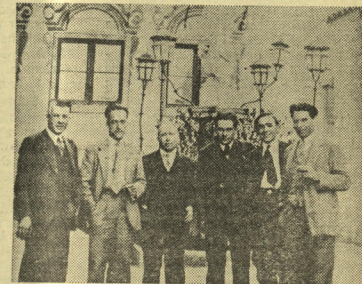
A Barcelone, en 1931, Vivanco, Garcia Oliver, Lecoïn, Pierre Odéon, Ascaso, Durruti.