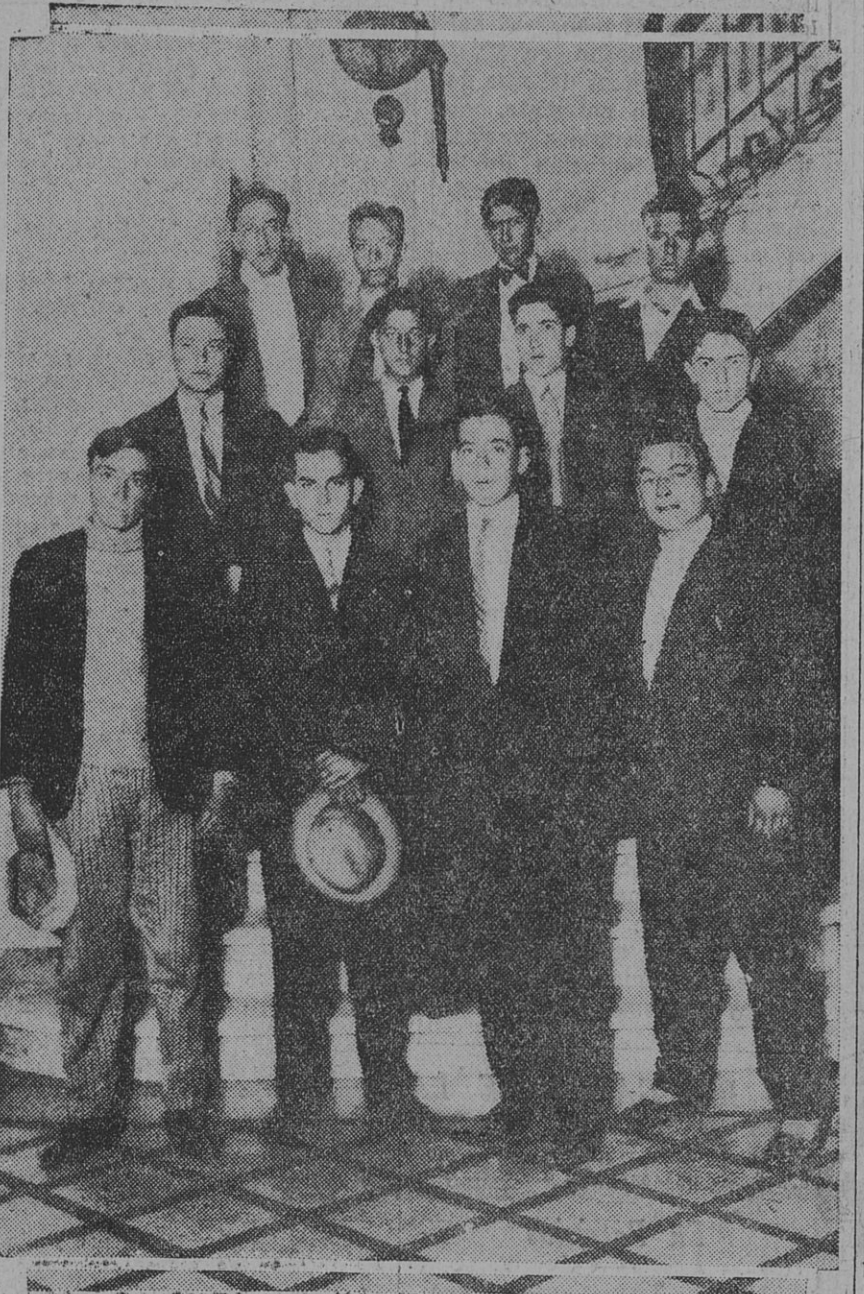
UNA DELEGACION DE LOS OBREROS, EN NUESTRA CASA

Para demostrar a la empresa que el personal desea ser respetado y que sabe ocupar el puesto que le corresponde en estos momentos de prueba, defendiendo el bien común con la fuerza de su unión, la consigna debe ser: No faltar a la asamblea del 22 de agosto, a las 16 horas."