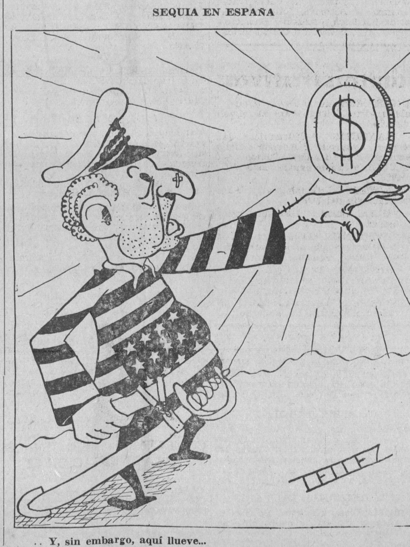
Y, sin embargo, aquí llueve...

pesinos colombianos sucumbidos en los últimos meses de la dictadura... « ¿ Acaso sirve para algo luchar ?... « Hay horas negras en el que el temple de todo luchador se revuelve en instinto egoísta ; quisiera desligarse de todo ideal y descansar, descansar para siempre. Vivir como los demás viven, placidamente, sin buscarse preocupaciones. A menudo la recompensa que recibe es la incompreensión, cuando no la calumnia. Es mucho más cómodo adaptarse a las circunstancias y dejar que las cosas sigan su camino ; otros medran y progresan, otros parecen ser felices. « Nunca me sorprende cuando me entero de que otro más ha ingresado en el inmenso batallón de los descorazonados de los hombres sin temple ; son simplemente humanos. Qué cosa del desprecio si lo venció el soborno ; de ordinario ni pienso más en ellos. Y comprendo al que guarda sus ideales en el fondo del corazón, para llevar una vida más tranquila. « Pero reservo mi admiración para quienes siguen sacrificándose ; y mi fe descansa en ellos. »