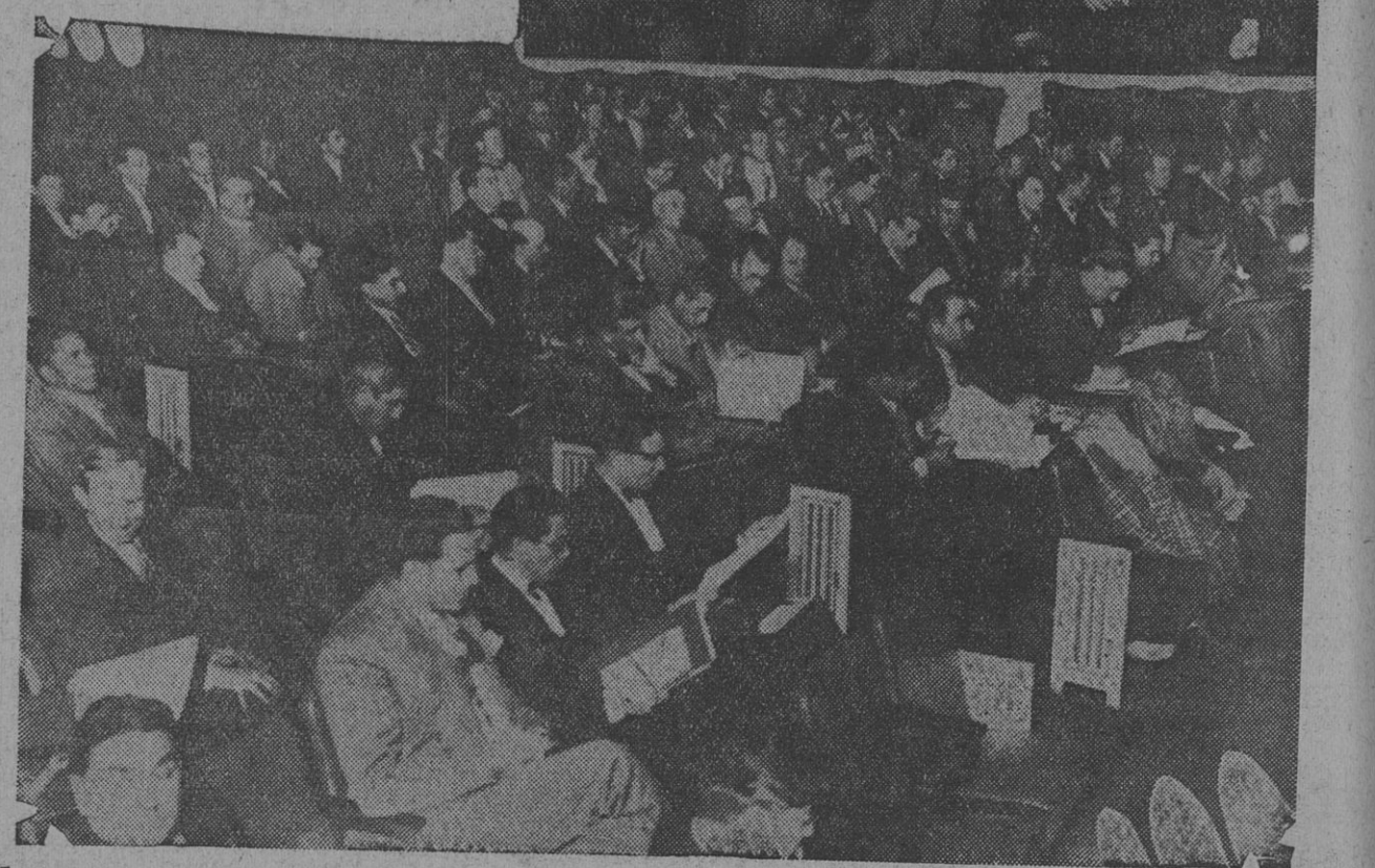
La mesa directiva y los delegados que asisten al congreso anual de la Unión Ferroviaria

17 horas, la presidencia hace sonar la campana llamando a sesión.