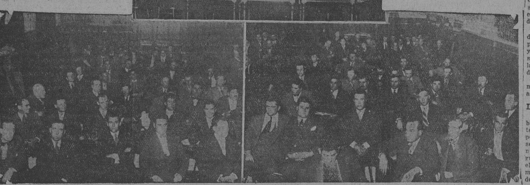
Arriba: La mesa directiva del congreso de los fraternales y abajo aspecto que ofrecía la asamblea

Intervienen en el debate otros oradores y luego, a las 20.30 horas, se pasa a cuarto intermedio hasta hoy a las 8.30.