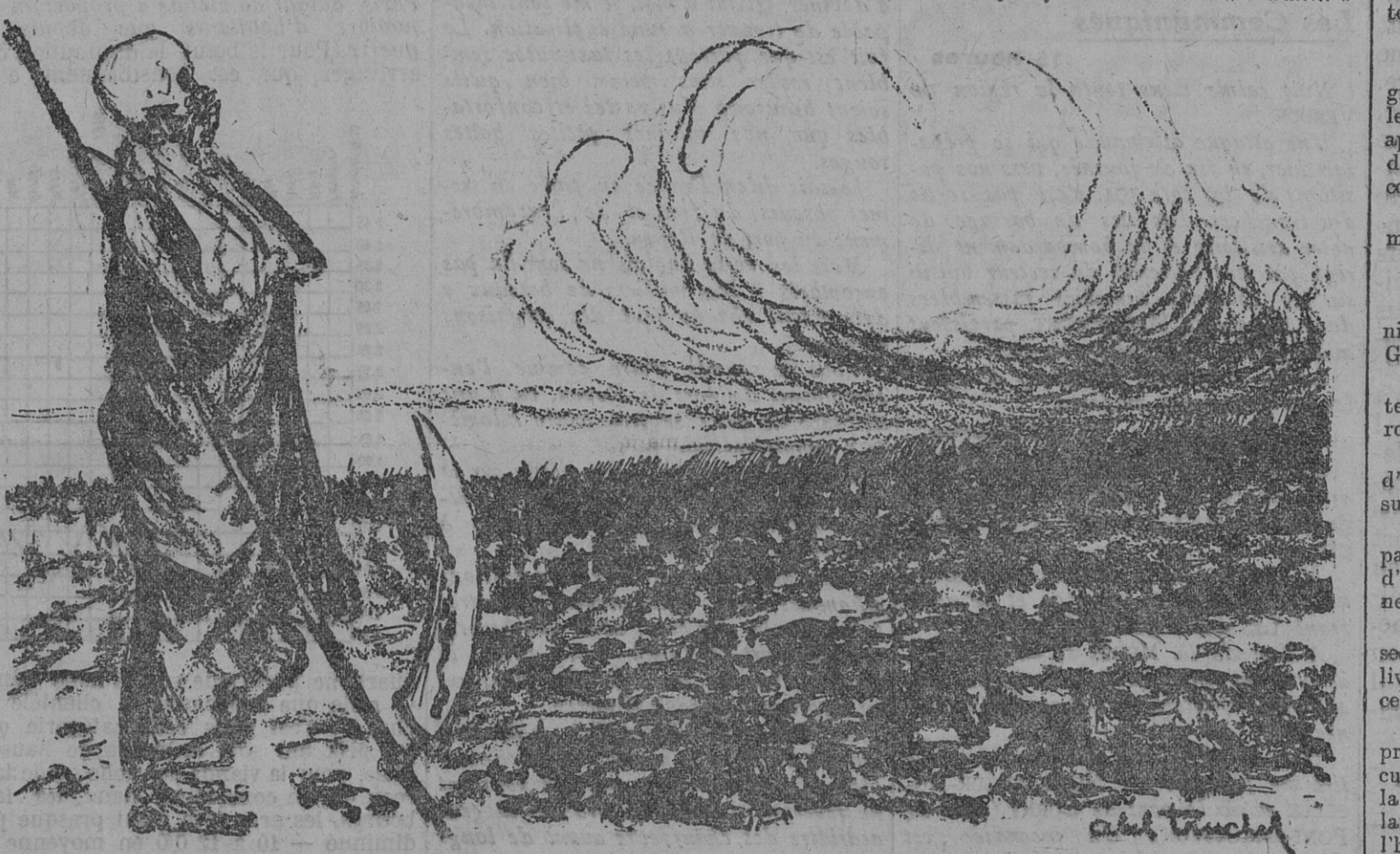
— Tu as raison... les premières commencent à se gâter...