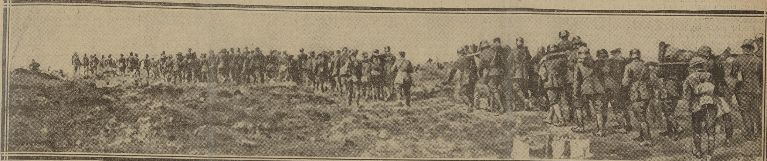
EN LONGUES FILES, DES PRISONNIERS QUI VIENNENT D'ÊTRE CAPTURES, SONT RAMENES VERS LES LIGNES DE DÉPART