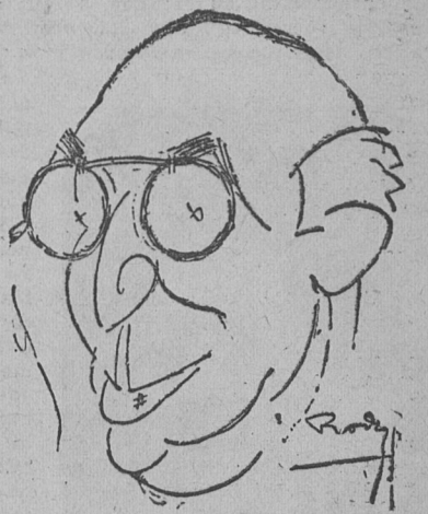
JEFE DEL GOBIERNO ESPAÑOL atacado con motivo de la huelga de campesinos a declararse el 5 de junio