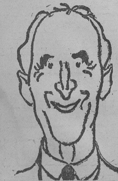
MINISTRO INGLÉS, QUE EN LA C. del Desarme propuso tres puntos para preparar acuerdos