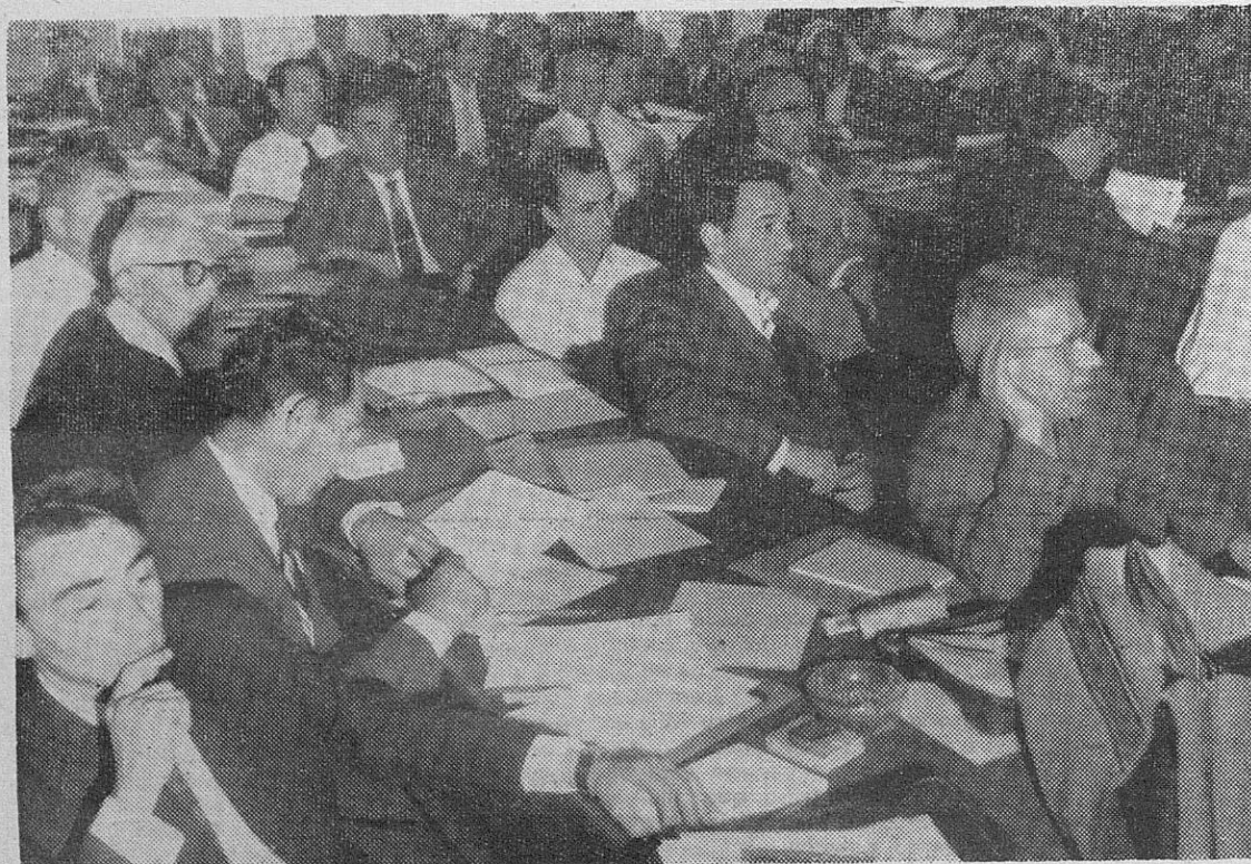
UNA VISTA DE PARTE DE LOS DELEGADOS

La Internacional minera ha seguido vuestras últimas huelgas con admiración y entusiasmo. Trataremos de impedir la entrada del régimen franquista en los organismos europeos, entrada que ese régimen se ha propuesto. La Internacional de los países que forman el Mercado Común ha definido bien su oposición y podéis estar seguros de que no cesará este combate hasta conseguir la victoria. Estaremos siempre a vuestro lado.