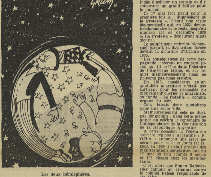
Les deux hémisphères.

« La Protesta » quotidien Le 7 novembre 1903 le périodique change de nom et paraît sous le nom de « Protesta ».