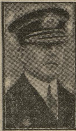
L'AMIRAL SIR DAVID BEATTY

Lorsque l'amiral Beatty se rendit à bord de la Princess-Royal , après que la poursuite eût été terminée, les marins le reçurent par le cri de : « Bravo! David! » (David est le prénom de l'amiral.)