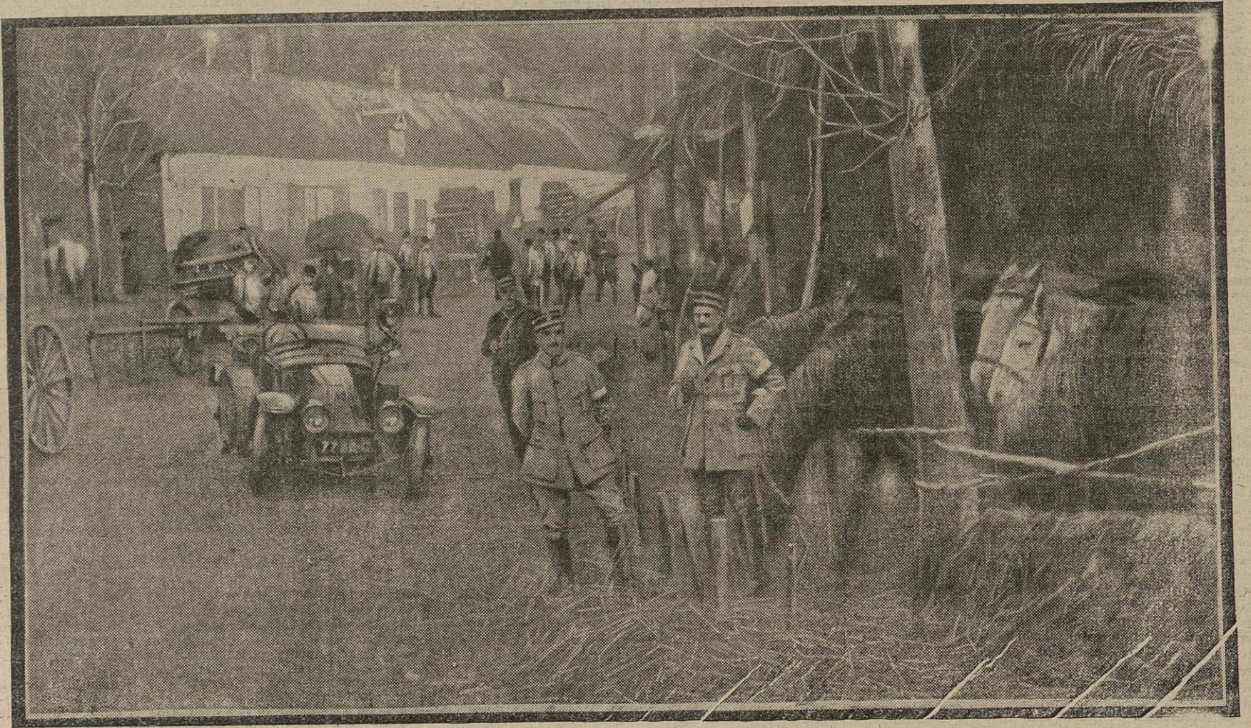
Près du front, nos artilleurs ont installé leur cantonnement dans un village. A l'entrée, des écuries de campagne ont été construites pour les chevaux du détachement qui, eux aussi, prennent un repos bien gagné.