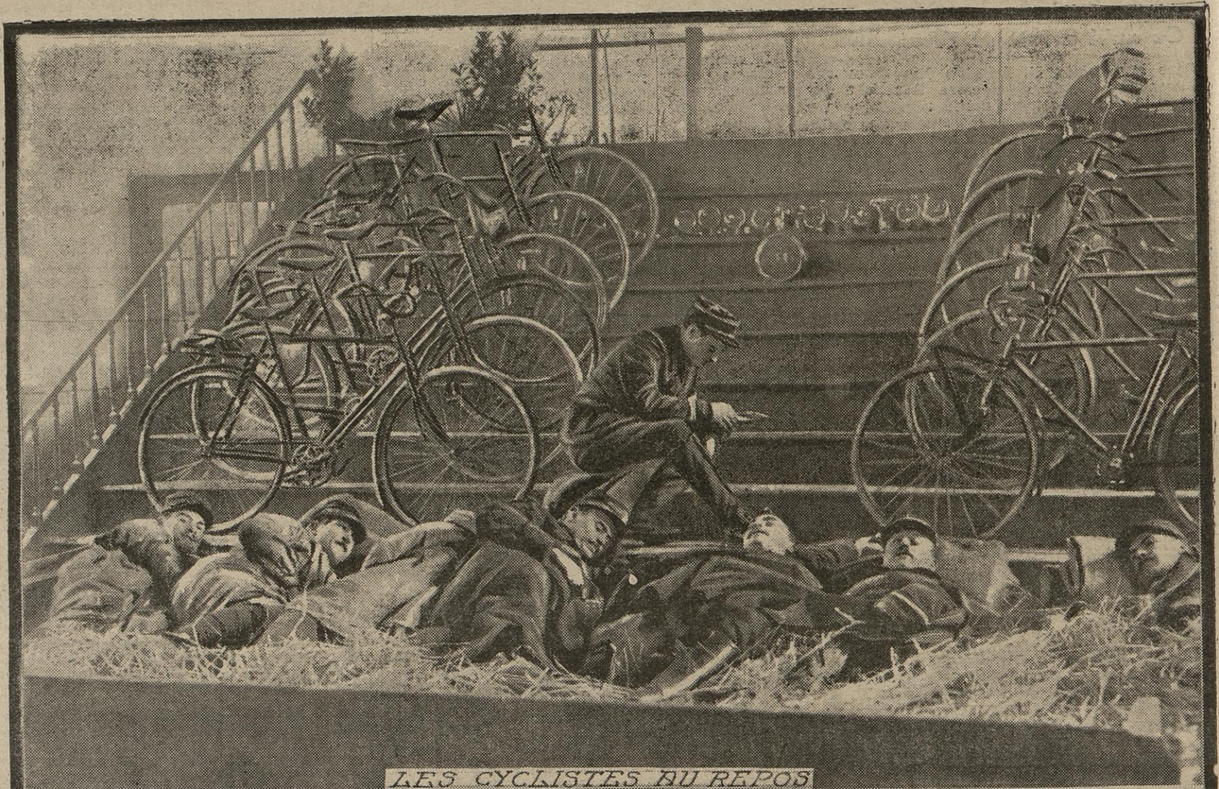
LES CYCLISTES AU REPOS