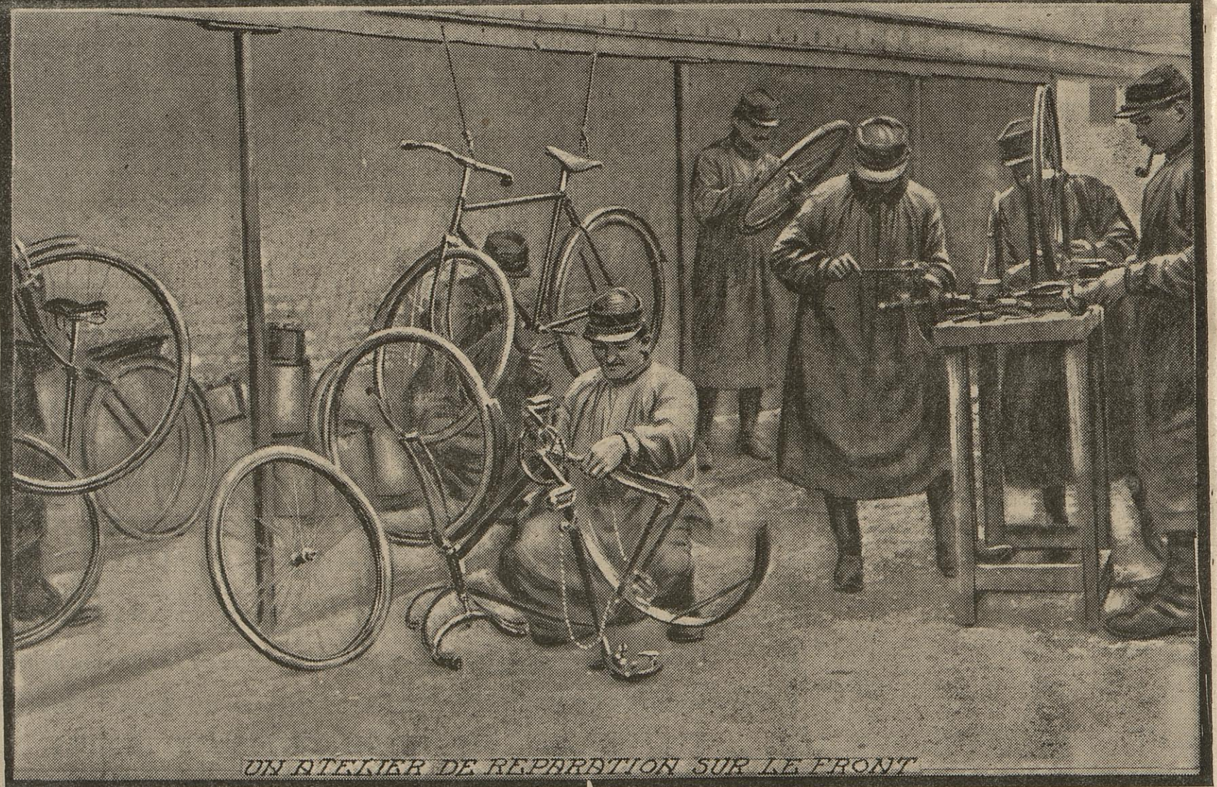
UN ATELIER DE REPARATION SUR LE FRONT

Depuis le début de la campagne, les compagnies cyclistes ont rendu les plus grands services aux armées. En mission, ces éclaireurs rapides ont déposé plus d'une fois déjà les patrouilles ennemies. Au moment de l'attaque, ils abandonnent leur machine pour aller dans les tranchées faire le coup de feu à côté de leurs camarades.