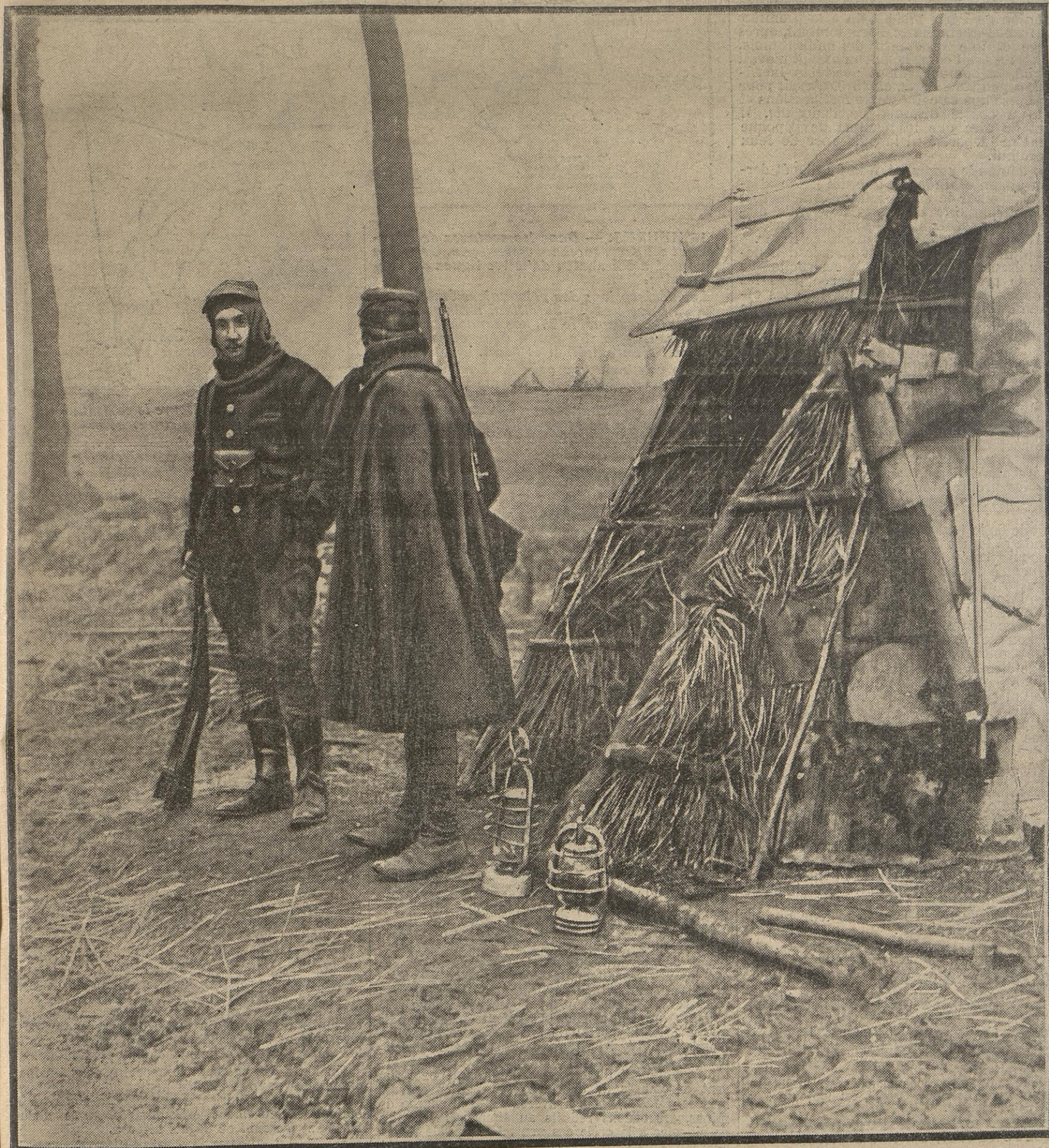
Pour se mettre à l'abri des intempéries, les cavaliers cyclistes qui assurent sur la grand'route le service de surveillance, ont construit une cahute à l'intérieur de laquelle ils viennent se reposer à tour de rôle. Un poêle, fait de vieux bidons, chauffe ce modeste abri, et une botte de paille sert de couchette à nos braves soldats.

ner (1), le ministre de la Guerre (2) a visité Aldershot, où il a passé en revue les troupes qui y sont cantonnées, ainsi que les divisions de territoriaux.