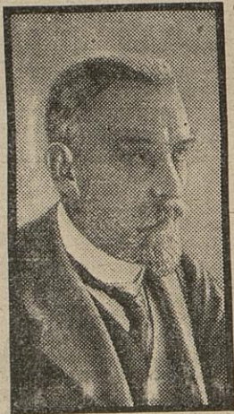
M. VON BETHMANN-HOLLWEG

Fidèle aux traditions germaniques de perfidie et de mensonge, M. de Bethmann-Hollweg prétendait avoir dit que le traité était devenu un chiffon de papier parce que la Belgique avait trahi sa neutralité en signant une convention militaire avec l'Angleterre. Sir Edward Grey prouve, dans sa note, que les déclarations du Bethmann sont en contradiction flagrante avec les faits :