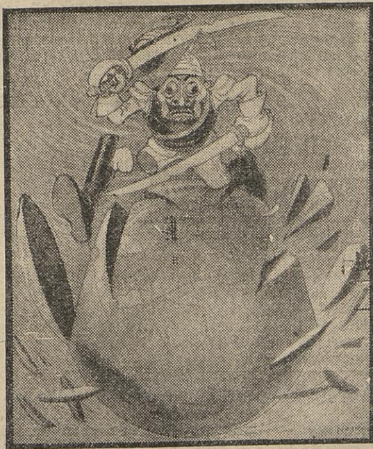
DELIRIUM TREMENS (Numero : Turin.)