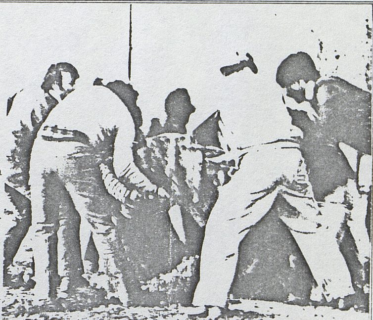
Chile: barricadas en poblaciones.