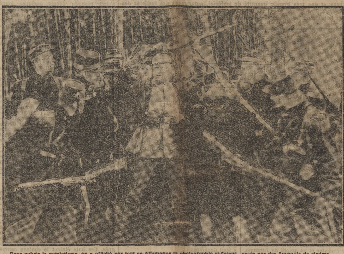
Pour aviver le patriotisme, on a affiché par tout en Allemagne la photographie ci-dessus, posée par des figurants de cinéma...