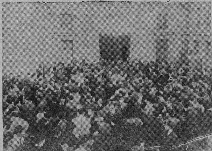
Part del públic que no pogué entrar al miting de Tolosa

Per fi el senyor Portela expressa a la U. N. E. i a tots els espanyols la seva cordial simpatia.