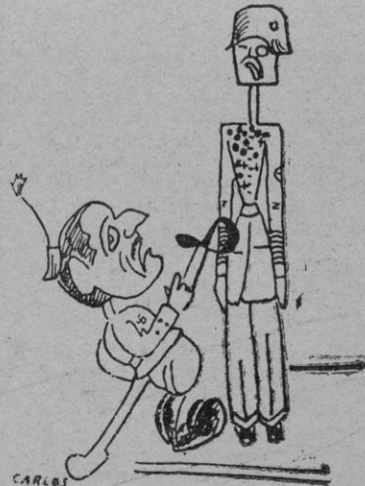
El general petit. — Viva la muer-tee..