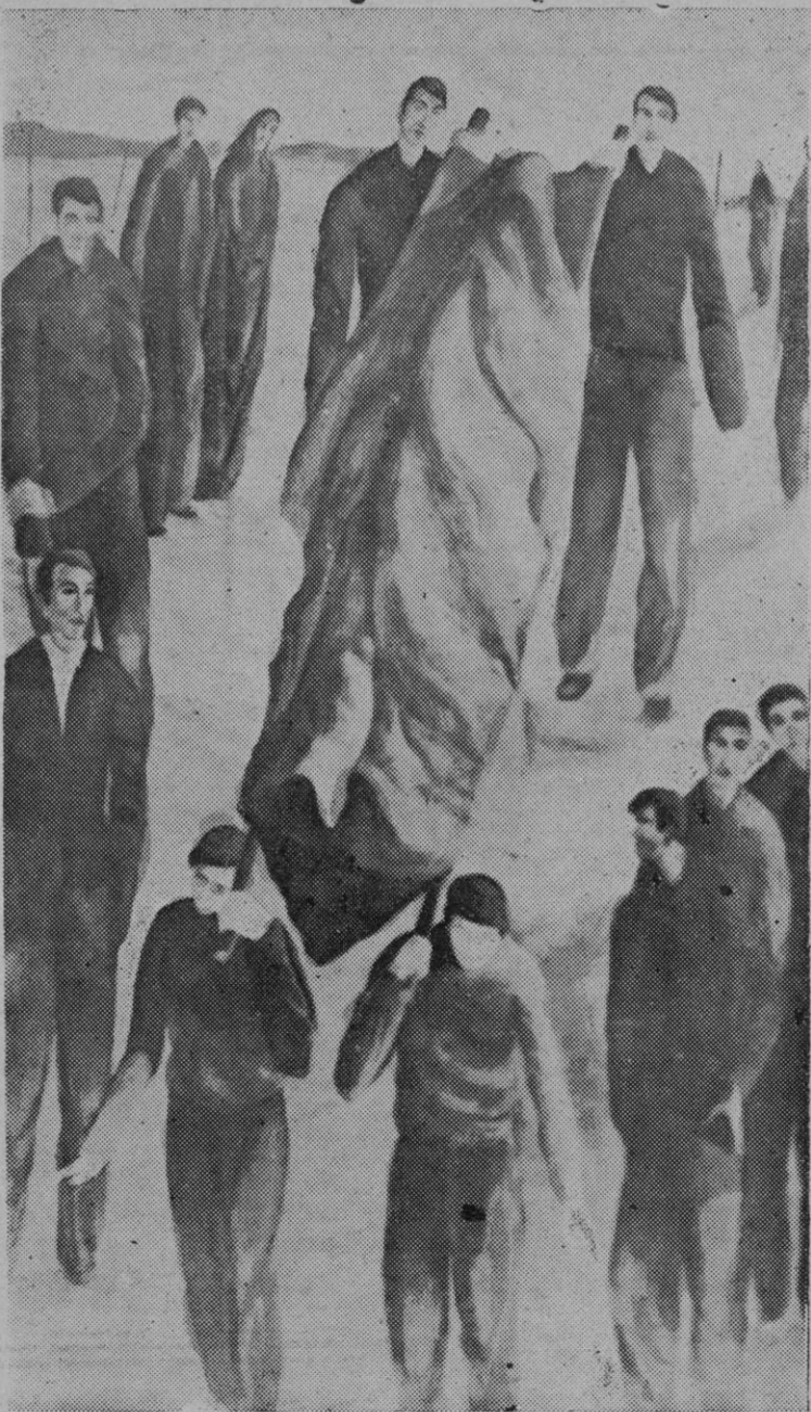
Enterrament al camp de concentració