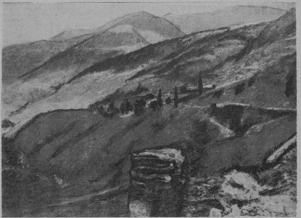
Fa uns dies la cadena dels Pirineus es presentava davant meu amb tota la seva gamma de colors. Els meus ulls travessaven aquesta barrera..

La premsa americana i anglesa, com tantes altres, augmenta igualment el to de l'ofensiva contra Franco i Falange. És una de les moltes conseqüències favorables de la nostra activitat. El Vaticà condemna una vegada més, adreçant-se a Espanya, «els règims que priven l'home de llibertat». Però no cal confiar solament en campanyes de premsa o declaracions oficials per a reduir els assassins. Espanya, com tots els altres pobles oprimits, té la paraula.