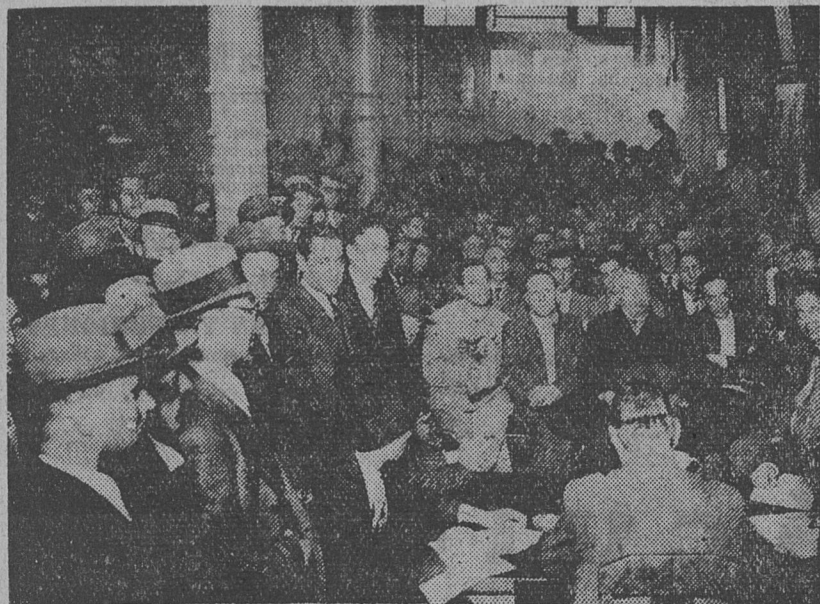
UNA VISTA DE LA ASAMBLEA DE MAQUINISTAS, AL RECIBIR LA NOTICIA DE LA SOLUCION DEL CONFLICTO

En la madrugada de ayer, la Sociedad Argentina de Empresas Teatrales, en una larga asamblea que se inició en horas de la tarde, pasando a cuarto intermedio hasta después de los espectáculos del jueves, resolvió aceptar las bases de arreglo presentadas por la Sociedad de Maquinistas, que publicáramos en la anterior edición. De acuerdo a ellas se envió por el gremio el personal nuevo del Fénix y dividió el anterior entre los teatros de la misma empresa. Sin mayores inconvenientes se reanudaron las actividades del teatro, que recobran así su normalidad — ayer mismo en el San Martín hubo que suspender una función para dar lugar a la preparación del estreno a ofrecerse en la noche — y librarse a los espectadores.