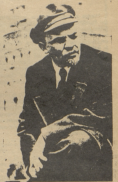
Lenin y Trotsky elaboraron la mayor parte de las históricas resoluciones de los cuatro primeros Congresos de la Internacional. Las Tesis Generales sobre Oriente, constituyen un documento fundamental del marxismo, sobre la lucha en los países coloniales.

Sin embargo, a medida que se ensancha y madura el movimiento de emancipación nacional, las consignas político-religiosas del is-