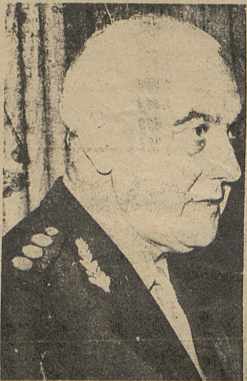
LANUSSE: Si la enfermedad no hubiese estallado en el riñón, lo habría hecho en la lengua.

A propósito de la larga discusión sobre el plan económico, que no ha terminado de aprobarse, se ha producido una polarización en el gabinete, en un ala "nacionalista" y otra "liberal".