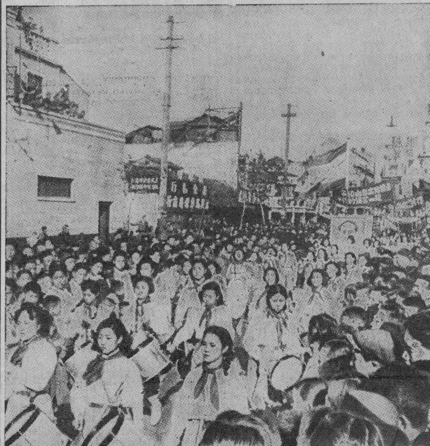
La victoriosa y alegre juventud popular china, en un desfile reciente por las calles de Nankín.

¡Así obran los verdaderos amigos de la España Republicana, las fuerzas del campo de la paz y de la democracia, aliadas naturales y fieles de nuestro pueblo, su insoslayable ayuda en la lucha por la libertad. Y ante esta nueva muestra de amistad — una más entre tantas — no se puede por menos, aunque se trata de cosas y términos incompatibles, de establecer el contraste entre esta actitud de los amigos verdaderos de nuestro pueblo y la de quienes, como los Gobiernos imperialistas de Estados Unidos, Inglaterra y otros, de dientes para fuera han declarado serlo, mientras siempre, y ahora más abiertamente, se trata de la tiranía franquista. Y ese contraste repite una vez más sin que nublen la realidad propagandas ni demagogías, dónde está la verdadera democracia,