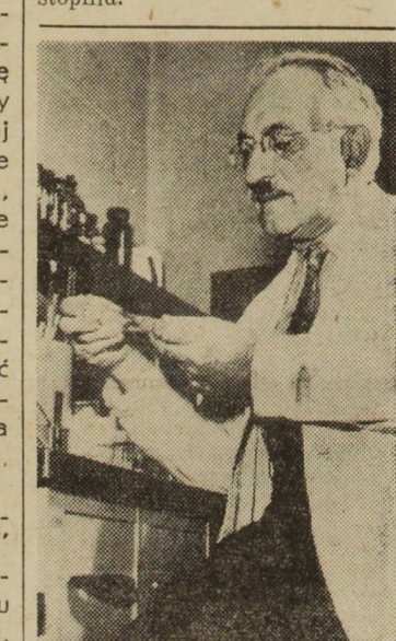
Dr. Selman A. Waksman, wynalazca streptomycyny, odznaczony Nagrodą Nobla. (1952) za swe prace w dziedzinie fizjologii i chemii oświadczył, że wraz ze swymi współpracownikami znajduje się w przedziez wy-nalazku środka leczniczego przeciwko katarowi i grypie.