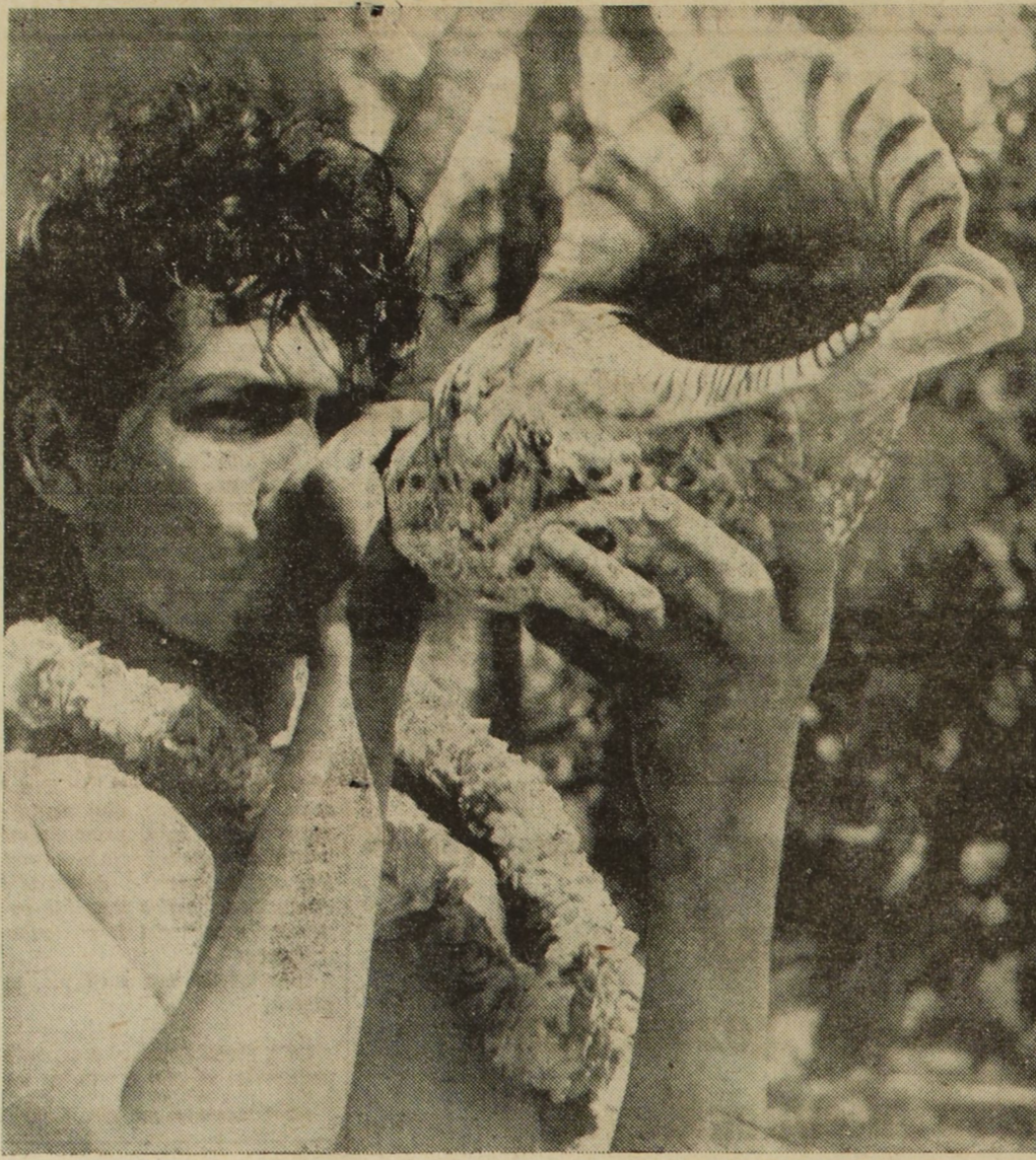
Musta morska ogłasza najważniejsze momenty z życia mieszkańców Tahiti (na wyspach hawajskich), ongiś wzywiała do składania ofiar, obecnie wzywya wiernych na nabożeństwo.