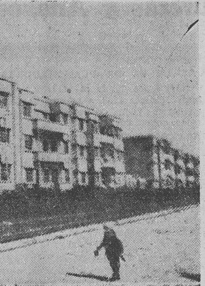
CALLE DE LA NUEVA CIUDAD OBRERA DE BAKU

La casi totalidad de los obreros empleados en la industria de la U.R.S.S. está organizada en uniones profesionales. Actualmente existen 44 de esos organismos que forman el Consejo Central Panosviético de Uniones profesionales. En el seno de cada empresa, los miembros de la unión eligen un comité de usina que ajusta la vida de los trabajadores. Las uniones profesionales se ocupan de las cuestiones de los salarios y del aprovisionamiento, de las condiciones de vida de los obreros y de la elaboración de los planes de producción; aseguran la protección del trabajo, contribuyen a formar cuadros de técnicos y de obreros calificados y despliegan una gran actividad social organizando cursos, espectáculos, certámenes, etc. Crean clubs para los trabajadores de cada empresa y poseen además su prensa.