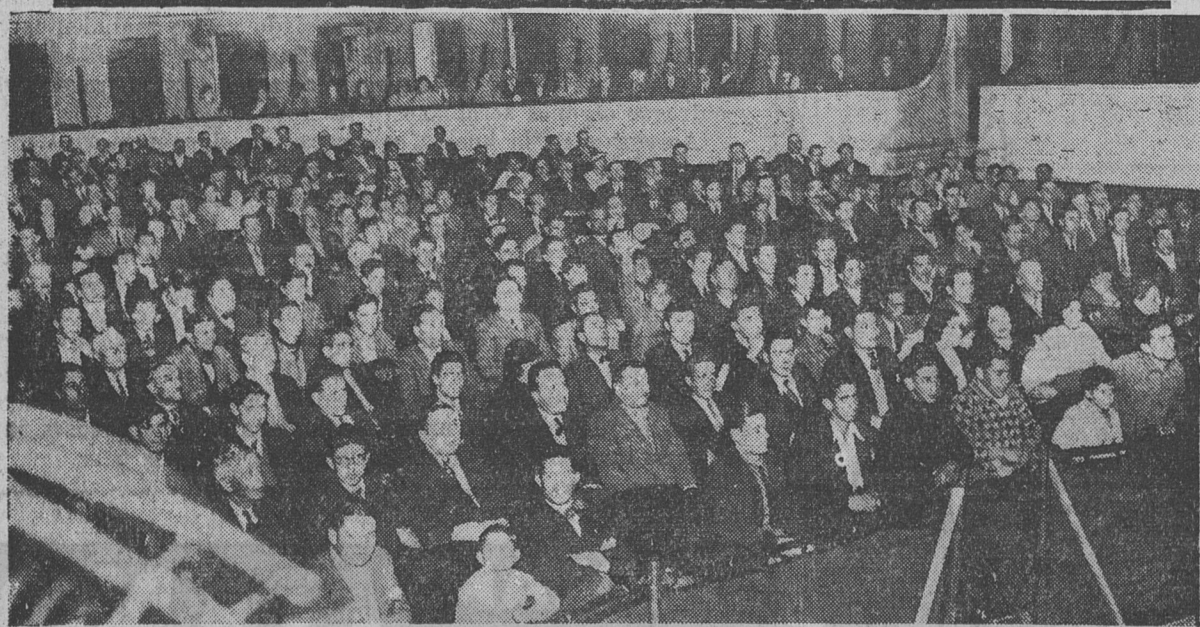
Numeroso público llenó ayer por la tarde la amplia sala del teatro Politeama, para presenciar el sorteo organizado por la Cia. Argentina de Tabacos, con que favorece la misma a los consumidores de los cigarrillos Barrilete, París y Regalía.