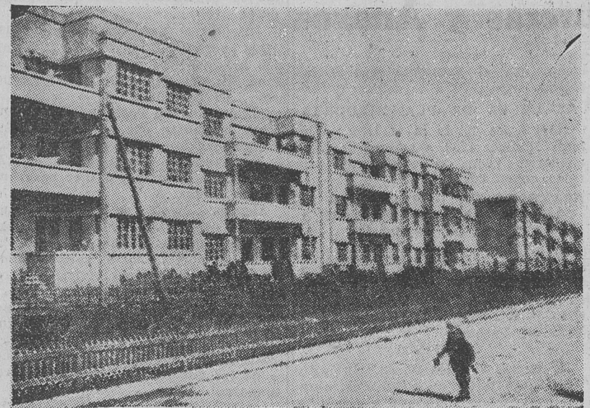
CALLE DE LA NUEVA CIUDAD OBRERA DE BAKU

LOS COMISARIADOS DE LA UNIÓN Existen en la actualidad en Rusia dos organismos cuyas funciones son parejas: la Directiva y el Consejo de