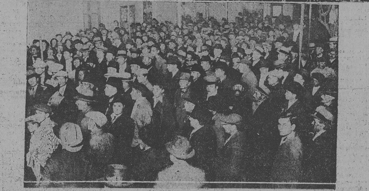
DURANTE LA VISITA A LA BIBLIOTECA AGUSTIN ALVAREZ, DE BERNAL. — FRENTE A la Casa del Pueblo de Quilmes. — Parte de la numerosa concurrencia que congregada en el interior de la Casa del Pueblo escuchando los discursos.

Dirigió luego la palabra el diputado Nicolás Repetto, quien exteriorizó la favorable impresión recogida en las visitas efectuadas, prueba de cómo la influencia de cada día más intensa y se confunden cada vez más con las necesidades colectivas. Bibliotecas que sirven a los fines de educación popular con amplio criterio, prosperas cooperativas, instituciones populares —como cuerpo de bomberos, hospital, etc.— donde la presencia socialista imprime a la acción una directiva fecunda, ajenas a las preocupaciones exclusivamente electorales y que acreditan ante los vecinos nuestra capacidad, de trabajo y de dirección en obras de utilidad general.