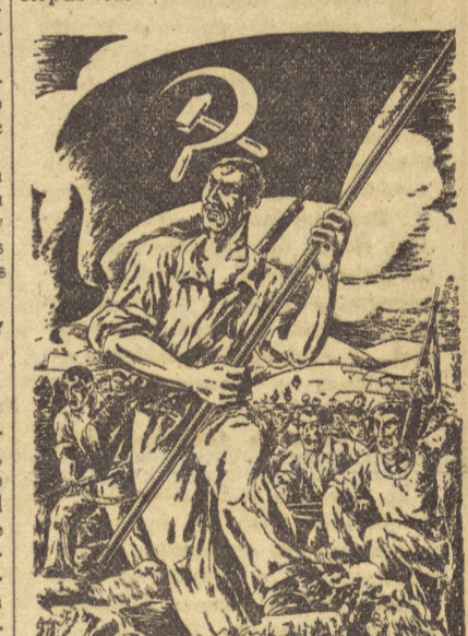
Copias de este documento circularon entre la colonia española de Rio y de Sao Paulo, siendo firmado por centenares de compatriotas.

Mañana comenzará en Bayona la gran Conferencia del Partido Comunista de Euzkadi. Los comunistas vascos se reúnen con objeto de estudiar la situación de Euzkadi en estos momentos decisivos para el porvenir de la democracia y de la libertad de todos los pueblos hispanos. Se reanuda así el camino de forjar un gran Partido Comunista de Euzkadi, vanguardia de la clase obrera y del pueblo, que garantice el porvenir de un país vasco libre en una Federación democrática de pueblos hispanos. La sesión de apertura es un acto público que tendrá lugar el día 22, en el cine Vox, de Bayona. El domingo 24 se celebrará un gran mitin de clausura en el frontón Plaza-Berri, de Biarritz, en el que intervendrán Cristóbal Errandonea, teniente coronel del Ejército de la República (que hablará en euzkera); Albert Mora, diputado a la Asamblea Nacional francesa, que dirigirá un saludo en nombre del P.C.F.; Juan Comera, secretario general del P.S.U. de Cataluña, consejero del Gobierno de la Generalidad; Leandro Carro, miembro del C.C. del P.C. de Euzkadi, diputado a Cortes de la República; consejero del Gobierno autónomo de Euzkadi; Vicente Uribe, miembro del Buró Político del P.C. de España, diputado a Cortes, ex ministro del Gobierno de la República. El acto será presidido por Mariano Bautista, comandante del Ejército de la República.