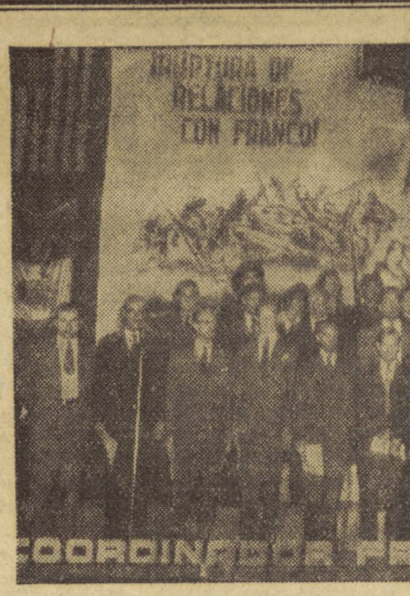
El ceto del C.I.O. durante su actuación en el acto del Manhattan Center, en Nueva York.

El domingo 17 de noviembre, en conmemoración del 29 aniversario de la Revolución Socialista de octubre y del décimo aniversario de la defensiva de Madrid, el Partido Comunista de España organizó grandes actos públicos en las más importantes capitales de Francia.