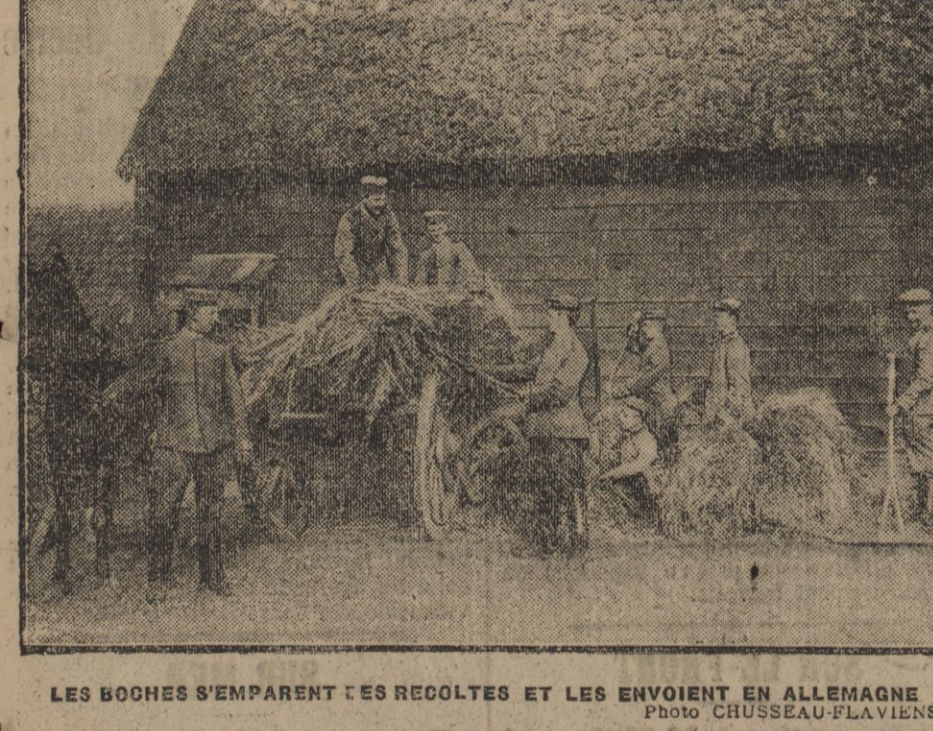
LES BOCHES S'EMPARANT DES RECOLTES ET LES ENVOIENT EN ALLEMAGNE

FEUILLETON DE LA PETITE GIRONDE DU 27 JUILLET 1915