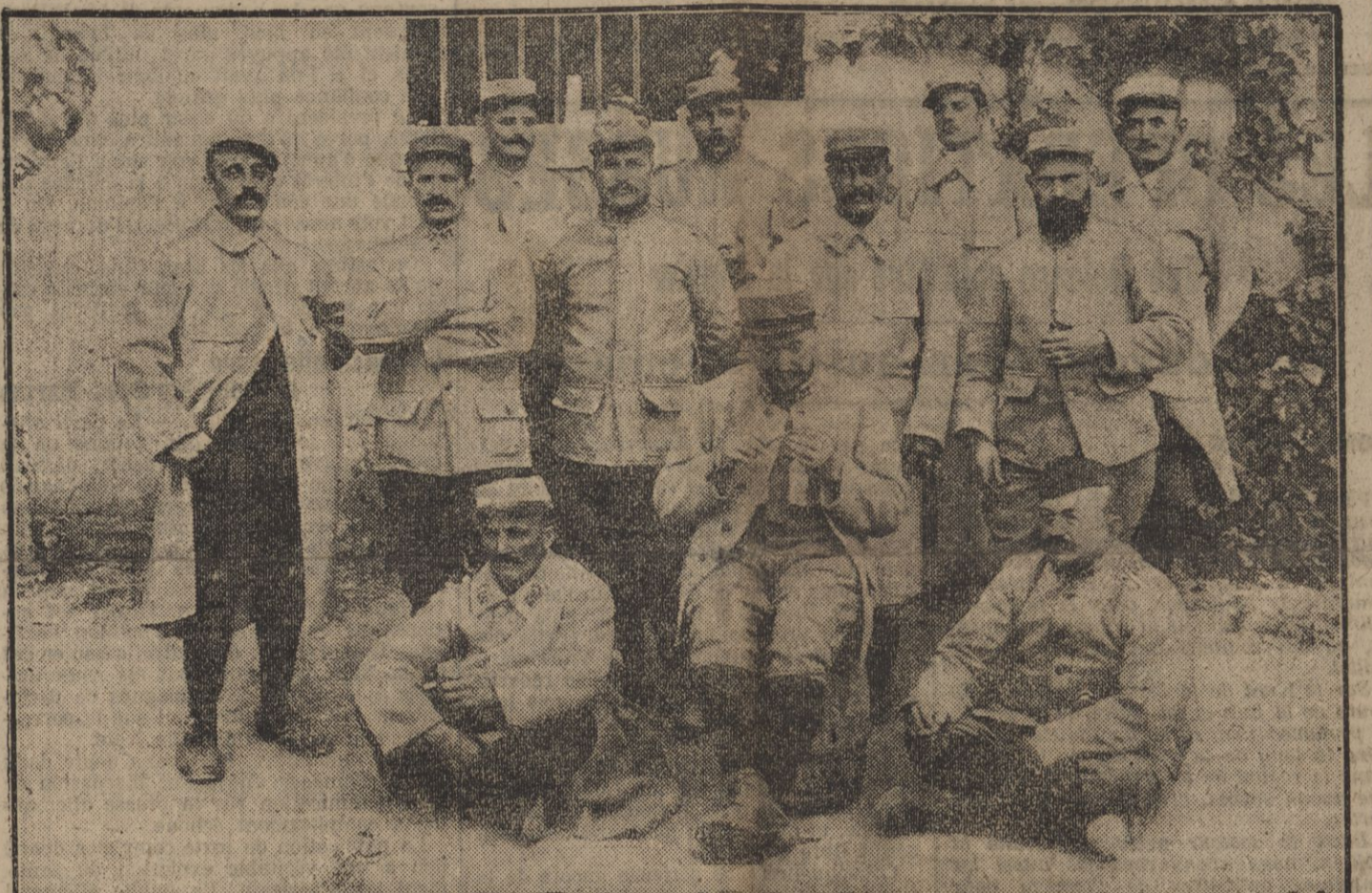
UNE EQUIPE DE « OUVISTOTS » (ouïstiers) DU 8e REGIMENT D'INFANTERIE