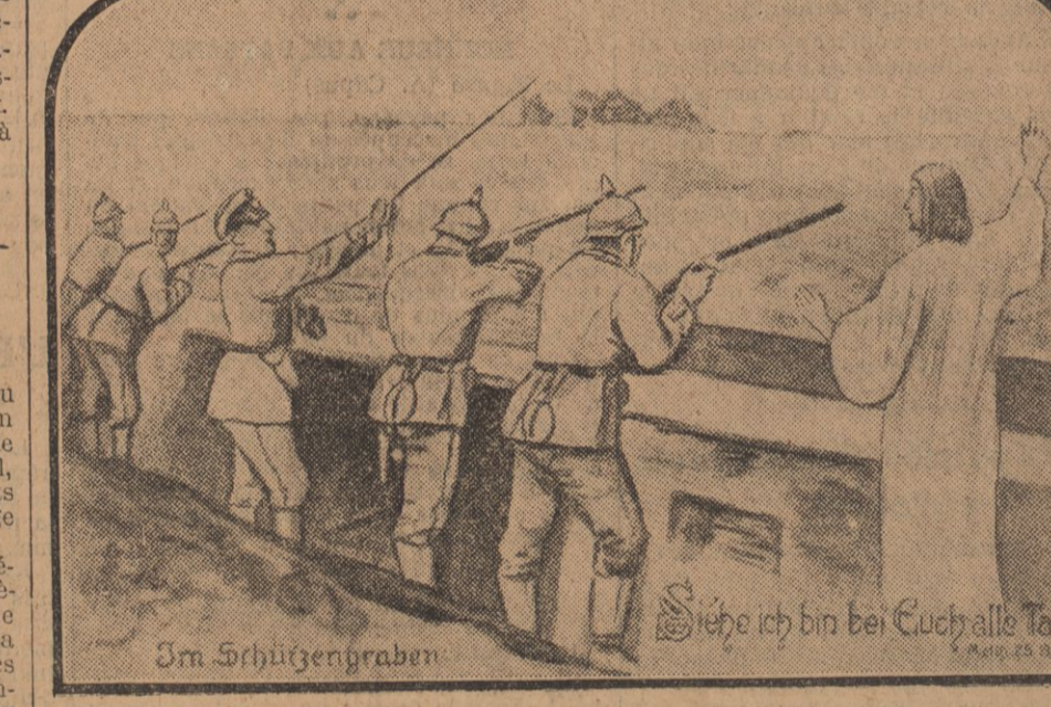
Cette carte postale, très répandue en Allemagne, porte, en guise de légende : « Voici que je suis avec vous tous les jours. » (Matth. 28, 20-21.)

Une demi-heure après, il revenait auprès du marquis.