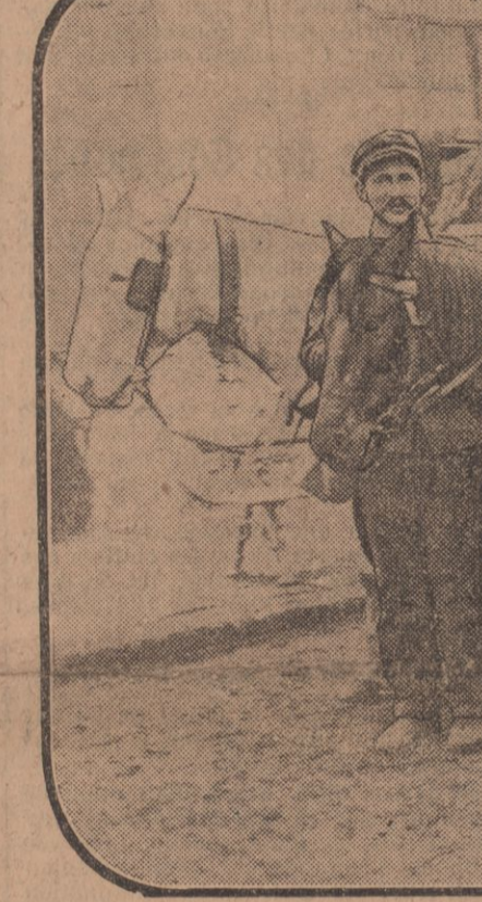
SOLDATS GRECS ÉVACUÉS LE 14 DÉCEMBRE