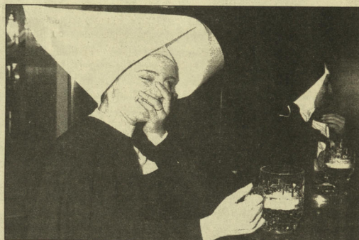
Lourdes, 1986 : deux (fausses) nonnes au bistrot. Le temps d'un film.

On nous raconte partout que le siècle prochain sera mystique. On se doute bien en voyant notamment les têtes de prie-dieu de Delors et de Balladur que le futur président de la République sera un calotin pur et dur. Elle est partout la calotte, plus envahissante que jamais. Des gourous du New Age aux charlatans de l'ésotérisme, des tartuffes barbus cachant d'un voile ces visages qu'on ne saurait voir au vieillard pontifiant qui met le nez dans nos fesses, les