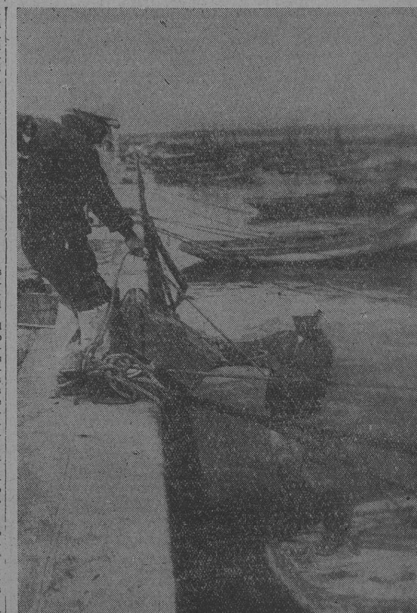
DOS TIPOS CARACTERISTICOS DE OBREROS PESCADORES

Después de conversar con esos rudos hombres de mar, de conocer detalles de su trabajo, de visitar la zona donde viven y tienen sus modestos hogares, apreciando cuán difícil es para ellos la existencia, la encantadora visión poética de los pescadores desaparece para dejar paso a una realidad desconsoladora. Son trabajadores que comienzan su tarea en las primeras horas de la madrugada y regresan doce o trece horas después; que están expuestos a las afecciones y peligros del mar; que ponen a cada instante a prueba su arrojo y su pericia en jor-