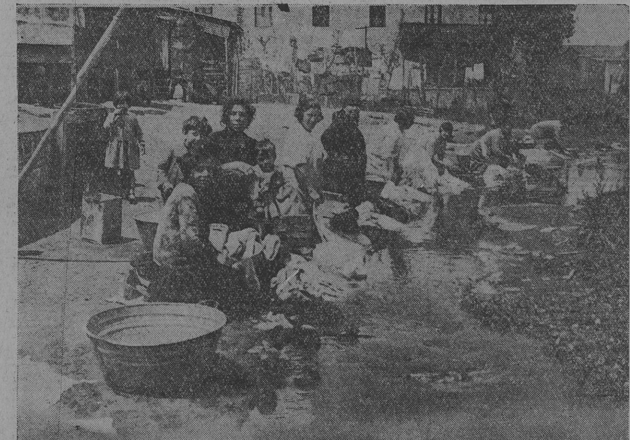
FAMILIAS DE PESCADORES LAVANDO ROPA EN EL ARROYO "DEL BARCO"

Pequeñas lanchas que no tienen en su casi totalidad más de 7 u 8 metros