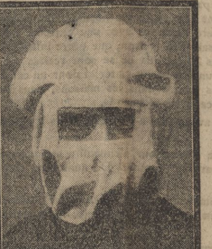
Masque employé par les troupes britanniques.