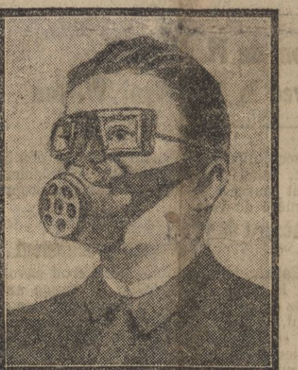
Masque employé par les troupes boches.