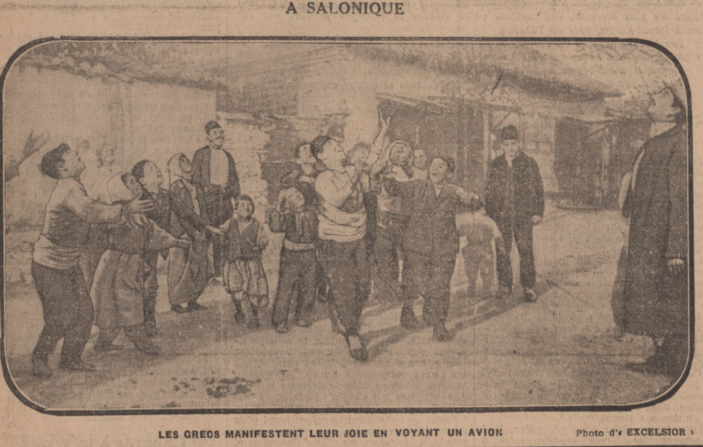
LES GREGS MANIFESTENT LEUR JOIE EN VOYANT UN AVION

PRIX DES ABONNEMENTS France et départements limitrophes : 3 mois 25 francs