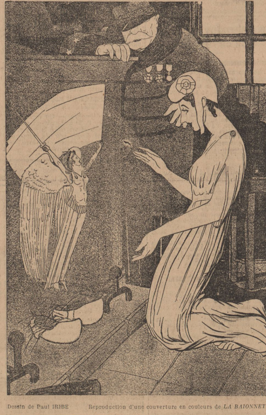
Reproduction d'une couverture en couleurs de LA BAIONNETTE