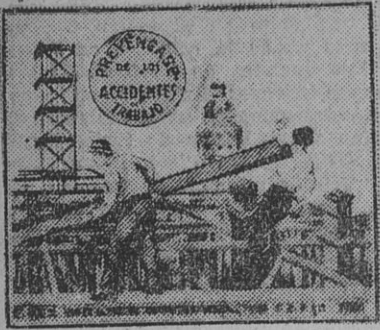
(Lámina de un trabajo del doctor A. Tiscornia.)