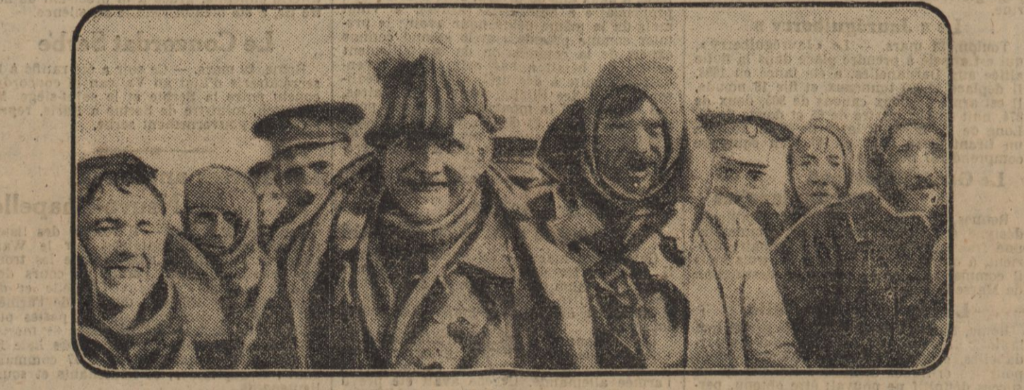
SOLDATS BRITANNIQUES RENTRANT DES TRANCHEES APRES LA VICTOIRE