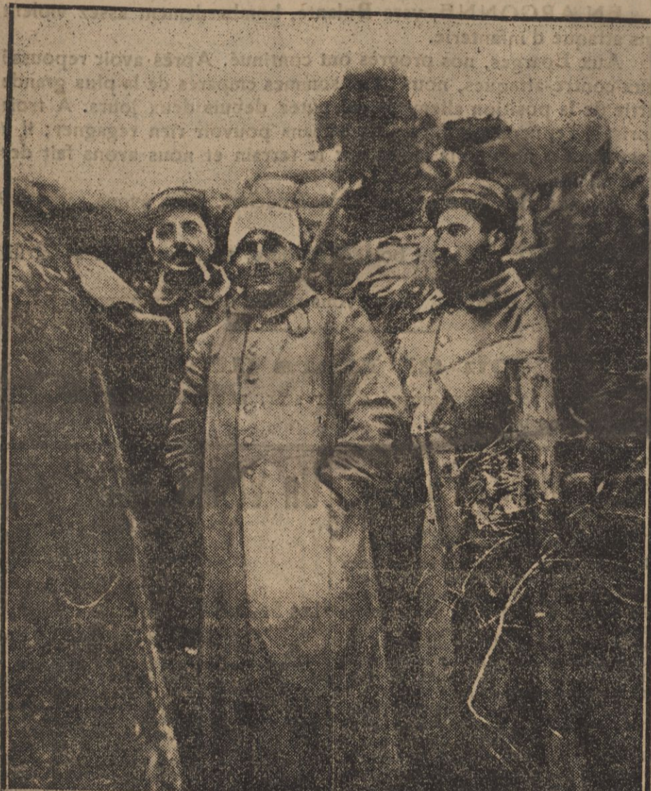
UN BORDELAIS JOVIAL VIENT DE REVÊTIR UNE CONFORTABLE CAPOTE DE BOUHE