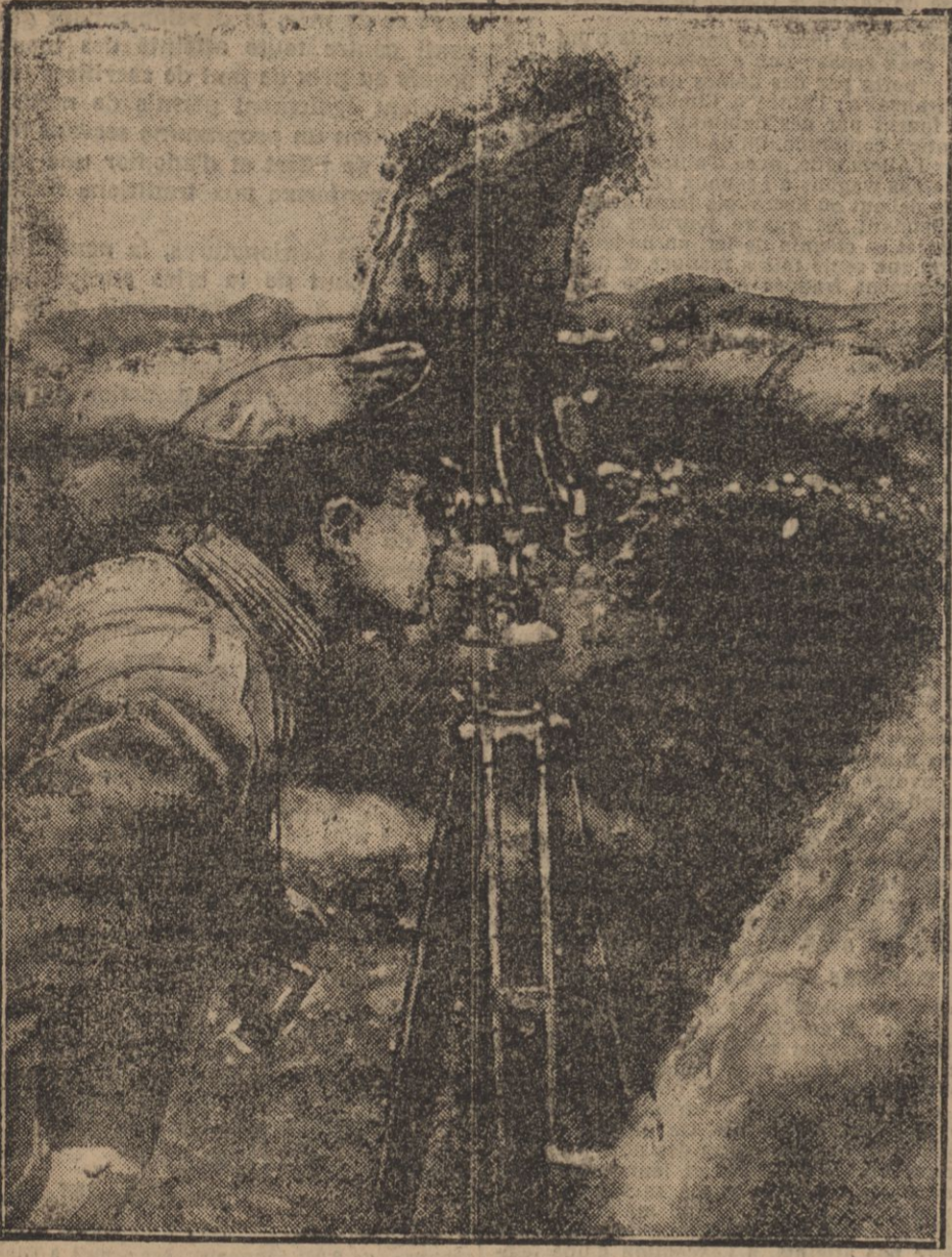
OFFICIER ALLEMAND OBSERVANT LE TERRAIN AU MOYEN D'UN PÉRISCOPE