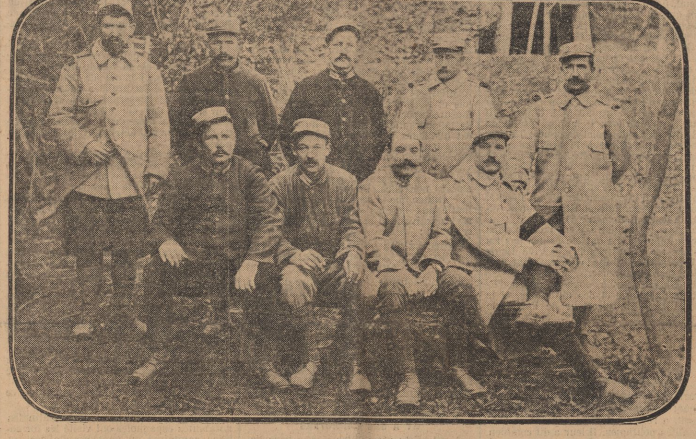
QUELQUES POILUS DU 17e REGIMENT