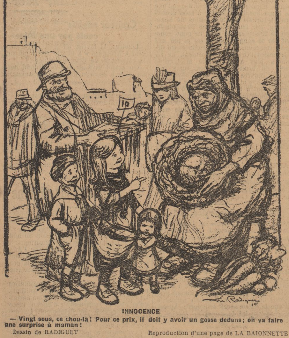
Reproduction d'une page de LA BAIONNETTE

LA VIE CHERE Vingt sous, ce chou-là ! Pour ce prix, il doit y avoir un gosse dedans; on va faire une surprise à maman !