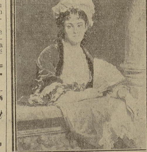
Mme HORTENSE SCHNEIDER (D'après le portrait de Dubufe)

Mme Hortense Schneider, la créatrice de la Belle Hélène, de la Grande Duchesse, et