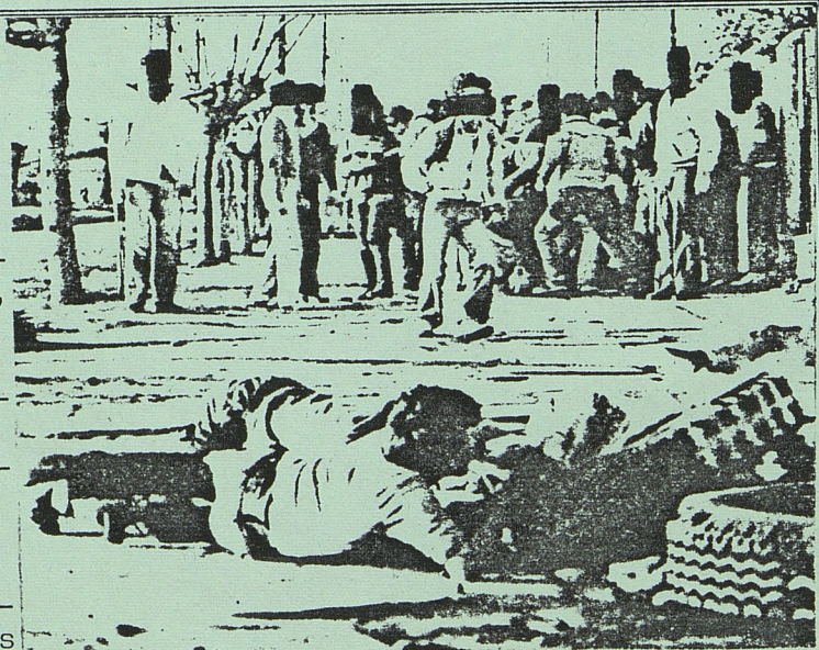
CHILE - Barricada Jornada de Protesta Nacional