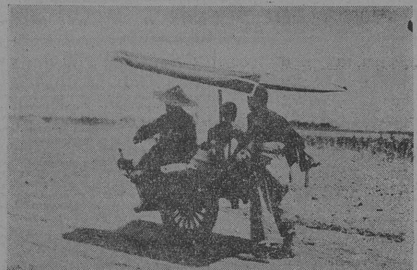
EN ESTE PRIMITIVO VEHICULO HUYE EL CAMPESINO de las tierras infectadas por la guerra civil. La tela le sirve de toldo contra el sol o de vela para propulsarlo.

la convicción que no era con el violento exterminio de "los diablos blancos" como se eliminara la opresión imperialista del extranjero.