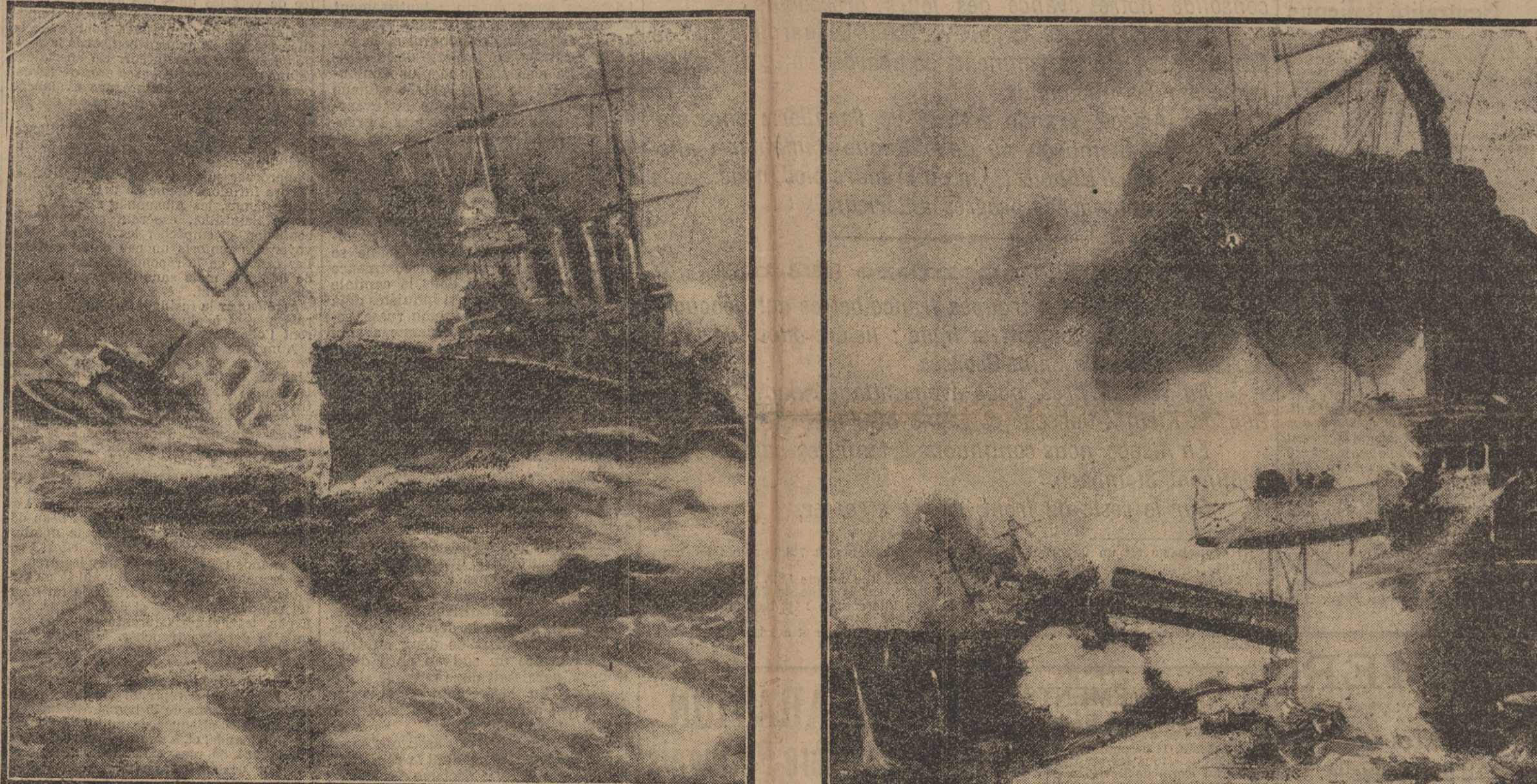
La bataille de Coronel, dans laquelle l'escadre allemande de l'amiral von Spee coula les croiseurs anglais « Good-Hope » et « Monmouth », avait provoqué en Allemagne un grand enthousiasme.

L'officier français n'est pas issu, comme l'officier allemand, d'un arbre généalogique et ne va pas rechercher ses racines dans l'orgueil d'un passé mort.