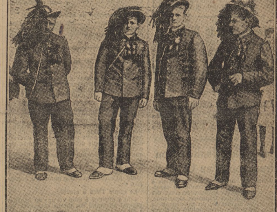
Les Troupes italiennes qui viennent d'occuper Valonia appartiennent au corps des Bersaglieri, et populaires au-delà.