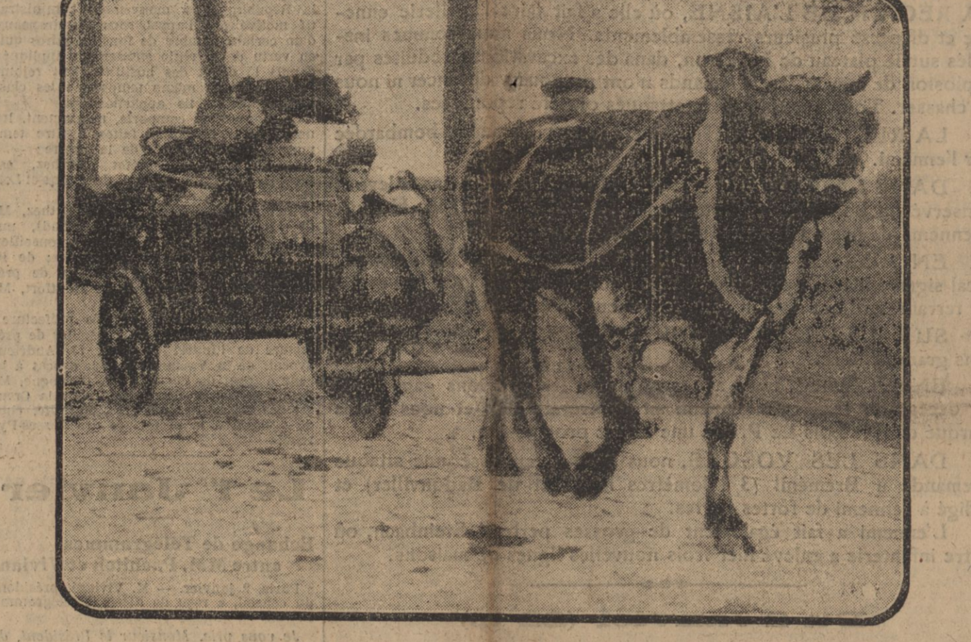
UNE FAMILLE DE REFUGIES QUITTANT LE PAYS NATAL