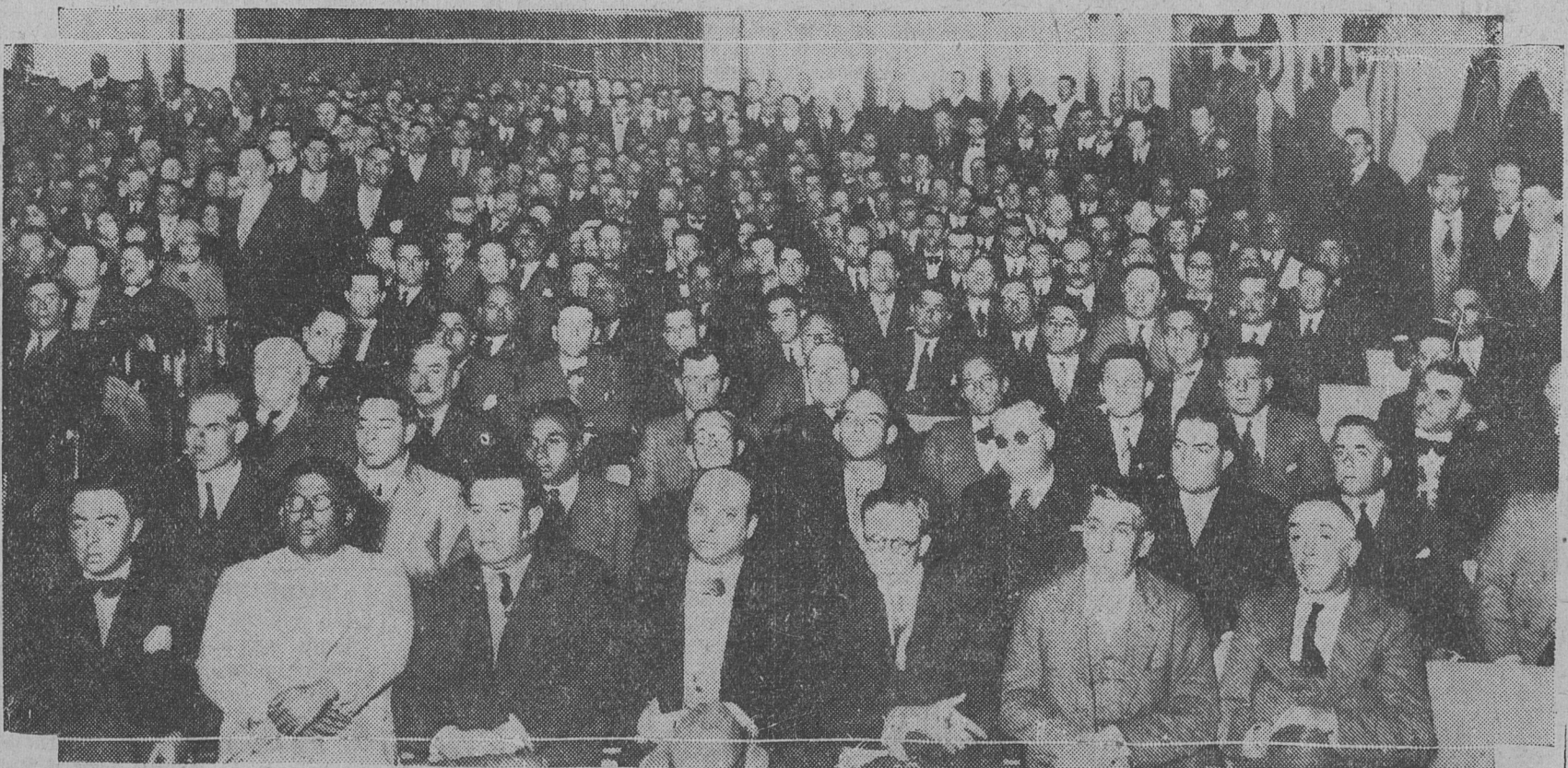
ASPECTO DEL SALON DE ACTOS DE “LA FRATERNIDAD” DURANTE EL ACTO DE AYER.