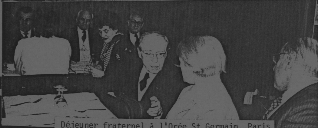
Déjeuner fraternel à l'Orée St Germain, Paris.