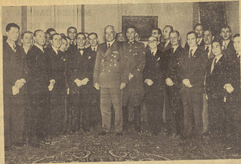
El grupo de periodistas extranjero recibido por Von Neurath en Praga.

primera vez dentro de tierra germánica buscando vivir una experiencia que yo creía necesaria para mi juventud: ¿Que es lo que quedaba de aquel