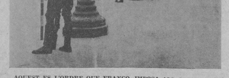
AQUEST ES L'ORDRE QUE FRANCO IMPOSA ALS CATALANS!

l·lur opinió sobre tots els problemes plantejats». Per altra part, volem assenyalar que el periòdic «Tu», òrgan de les Germanades Obreres d'Acció Catòlica, ha estat novament suspès pel ministre Blas Pérez per no haver-se volgut resignar a la rigorosa censura prèvia que els fou imposada. Encara que aparentment s'hagi restablert la calma, continua impertant un nerviosisme molt accentuat en tots els sectors de la població. Les