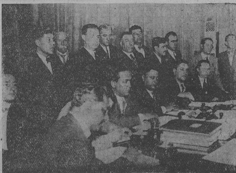
La comisión directiva de La Fraternidad