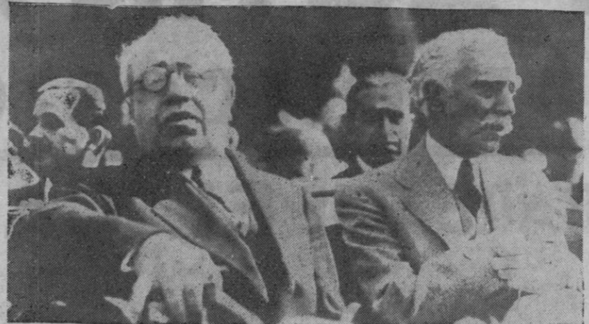
ESQUERRA REPUBLICANA DE CATALUNYA no oblida la noble figura republicana — perseguida per la Gestapo i pels franquistes a França — i n'és una prova l'adhesió entusiasta amb cada una dels militants del Tarn i Garona acudint a les actes commemoratives.

Gran Bretanya, França, URSS i Xina, de la mateixa manera que la qüestió de Berlín, per interposició del veto soviètic en el Consell de Seguretat, roman en un punt mort.