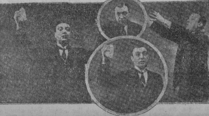
Salvador Seguí, el « Noi del Suro », l'orador popular que s'imposava a les masses per la seva fermesa i sinceritat.

« La Lucha » és el full diari característic d'una època en què els dirigents republicans s'agitaven amb menyspreu dels innombrables entrebancs que els entornaven.