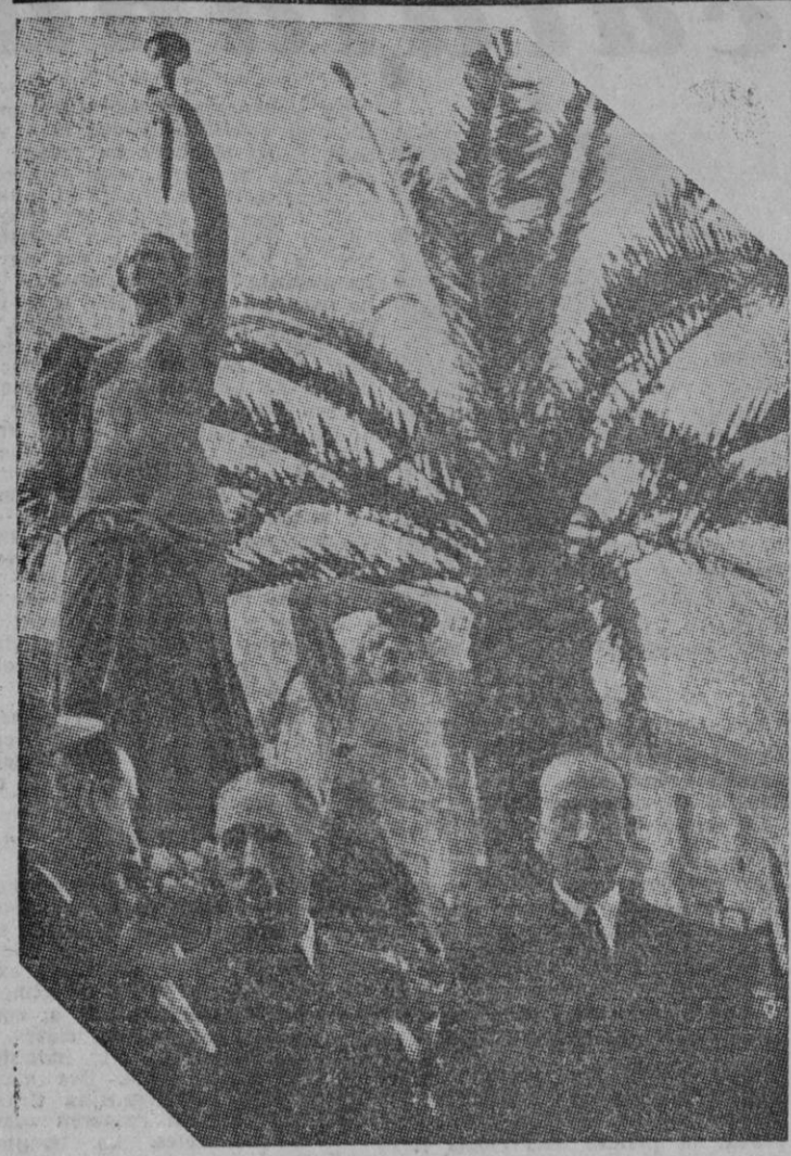
En l'aniversari de l'assassinat del líder obrerista i republicà, Lluís Companys i Eduard Layret s'acudiran cada any al monument de la plaça Sepulveda on acudia un gran nombre de catalans.