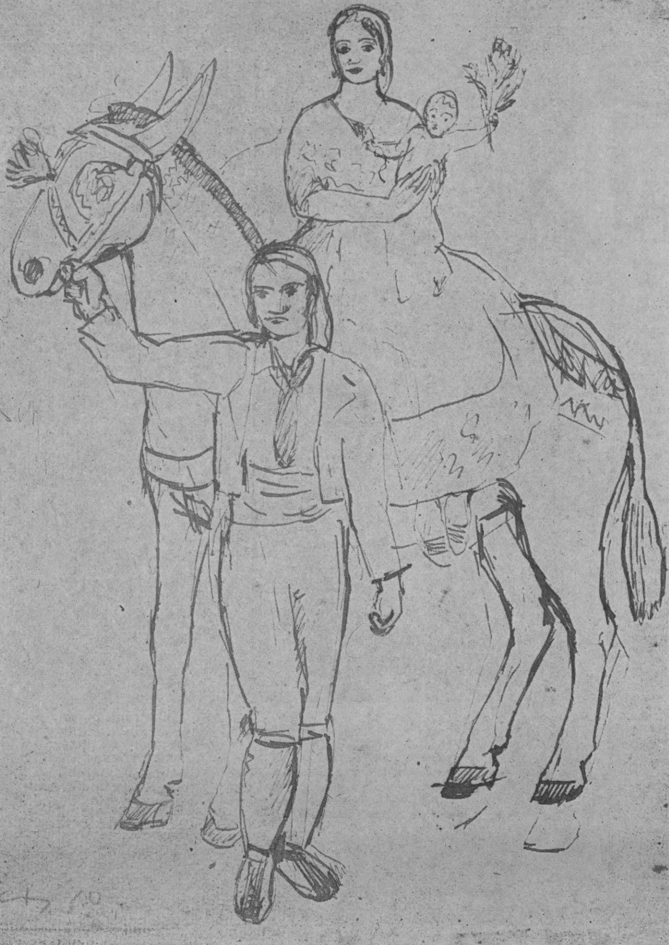
(Dibuix de Picasso, de l'època barcelonina)

Ja cau la tardor pallida i esfulla sa corona de pàmpolis, que l'oratge marçits i llagrinosos, arrossega com esperances mortes.