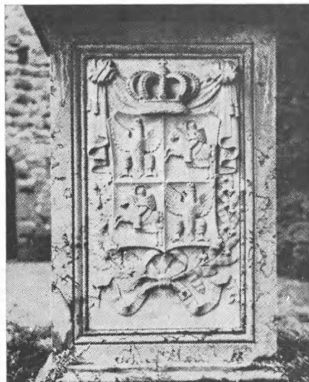
Rapperswil. Fragment Polskiej Kolumny Wolności: Herby Polski i Litwy.