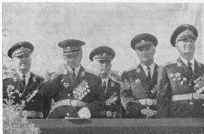
Przewódcy Wojskowi Bułgarii