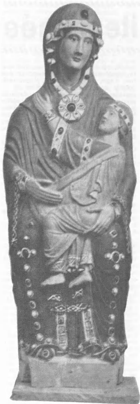
Statua della Madonna della Mentorella, Madre delle Grazie (sec. XII) - Santuario della Mentorella CAPRANICA PRENESTINA

Święta Bożego Narodzenia – Święta Miłości, Nadziei i Pokoju. Święta te w obecnym świecie i warunkach całkowicie surrealistyczne. Miłości zaznajemy mało, nadziei żyjemy coraz mniej a pokój, który uśmiercono 1-szego września 1939 roku do dziś nie zmartwychwstał.