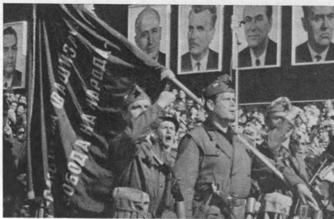
Czerwona Armia Bułgarska