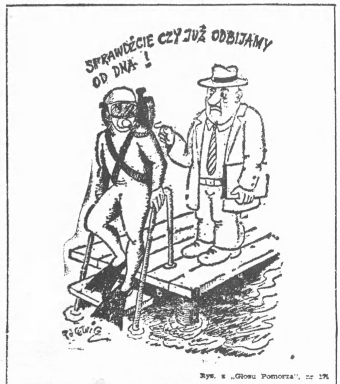
Rys. z „Głosu Pomorza”, nr 174