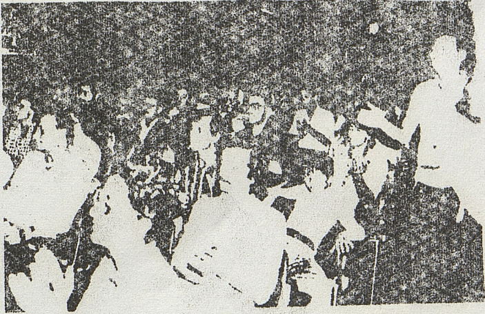
EL FRENTE DEL PUEBLO DE CHILE REALIZO EN EL MES DE SEPTIEMBRE 25 ACTOS EN ITALIA .

FOTOCOPIA DE UN VOLANTE RECIBIDO EN SANTIAGO EN EL MES DE SEPTIEMBRE