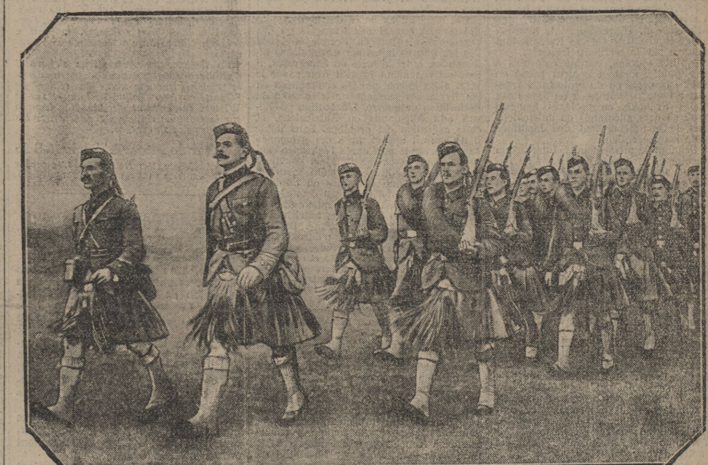
LE DEUXIÈME BATAILLON DE VOLONTAIRES ECOSSAIS DE LONDRES