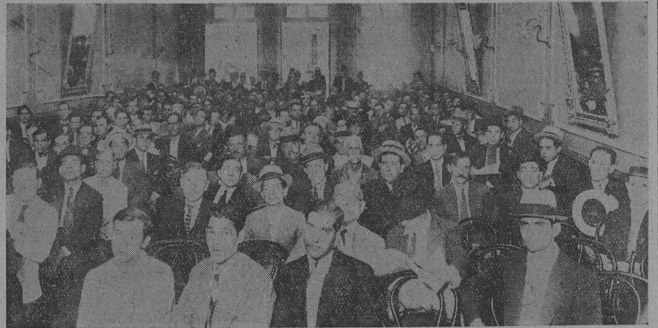
UNA VISTA DE LA CONCURRENCIA QUE ASISTIO A LA ASAMBLEA CONVOCADA POR el Sindicato de Obreros en Calzado

Los sacrificios realizados, serán recuperados por los huelguistas porque llegarán a imponer a la dirección de